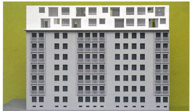
Maquette montrant le montage des éléments de façades