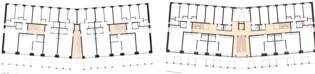
Plan du 1 er étage (g) L'ascenseur ne dessert que les appartements du milieu. L'accès aux autres appartements est possible par les passerelles. Au 3 e étage (d), la «rue intérieure» met en relation l'ascenseur et les cages d'escaliers situées à l'Est et à l'Ouest. DR