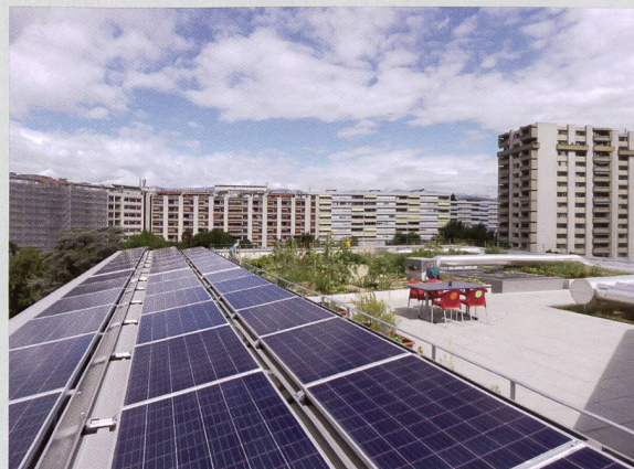
Les panneaux solaires se partagent l'espace du toit avec une terrasse et un potager communs.

Si tout le monde n'est pas devenu membre d'EnerKo, en revanche, par décision des conseils d'administration d'Equilibre et de Luciole, les habitants sont membres de la communauté d'auto-consommateurs. «Cette appartenance apparaît comme une annexe au bail. De facto, un habitant aurait pu refuser, mais le cas ne s'est pas présenté», poursuit le co-RMO. Au début de l'été, des négociations étaient encore en cours avec les SIG à propos du type de contrat les liant à la communauté d'autoconsommateur, qui souhaiteraient être contractuellement liées à un représentant de la communauté d'autoconsommation. L'installation, dont la conception et l'installation s'est élevée à quelque CHF 60 000, a bénéficié d'une subvention fédérale de CHF 16 390. Elle produit un kWh à 22 ct (hors TVA), soit l'équivalent du prix du kWh SIG Vitale bleu mais de qualité SIG Vitale soleil (100% solaire) à 34 ct (hors TVA). VB