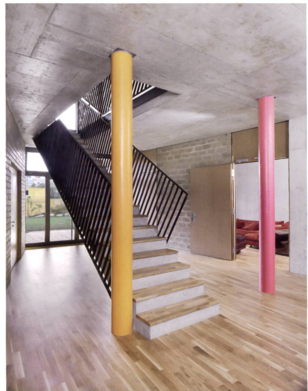
Le hall d'entrée et une petite salle commune.

Le paramètre économique est très présent. Par exemple, les coopérateurs ont opté pour un système d'auto-épuration de l'eau (lire ci-contre). Un promoteur de logements modéré classique ne se serait jamais lancé dans pareille aventure, ne serait-ce qu'en raison des centaines de milliers de francs à investir. Mais Equilibre et