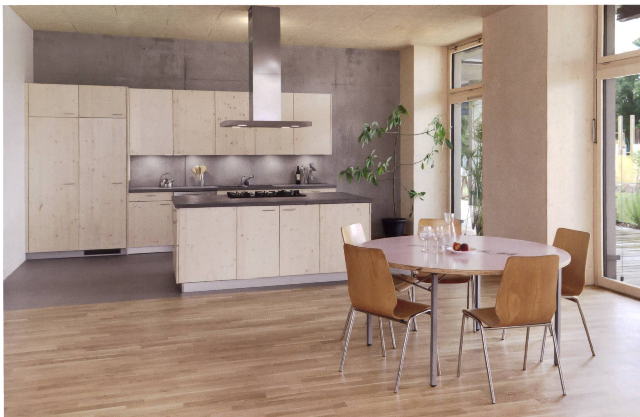
La grande salle commune.