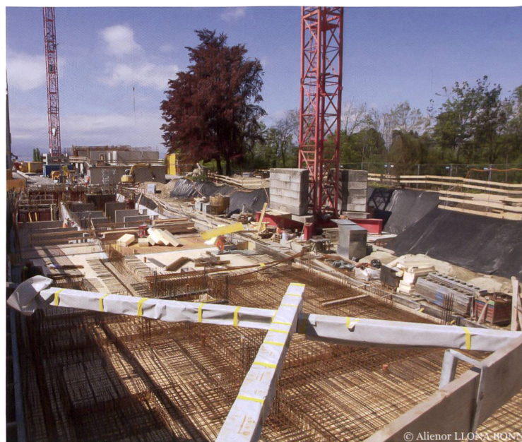
Le site est situé sur un terrain étroit, entre la rue de la Sallaz et les Falaises.

Du côté des maîtres d'ouvrage, rencontrés au début de l'été, si le développement du projet se vivait davantage dans le voyage que dans la destination, l'évocation de la