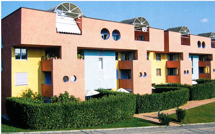
Lotissement Novazzano de Alloggi Ticino SA, conçu par Mario Botta.