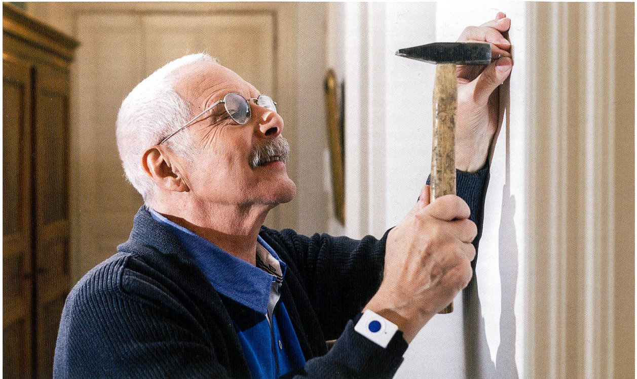
Le bracelet-alarme que l'on met au poignet est à la fois très sécurisant et très pratique (modèle de SmartLife-Care).

Commençons par la porte d'entrée de l'immeuble. Quelqu'un sonne à l'entrée de l'immeuble en utilisant l'interphone. Qui est-ce? Plutôt que de presser la touche d'ouverture de la porte sans savoir qui a sonné en bas, on regarde l'écran installé chez soi qui montre ce que la caméra filme à l'entrée. On voit qui a sonné, et on est rassuré (ou non). Un autre système est celui qui transmet