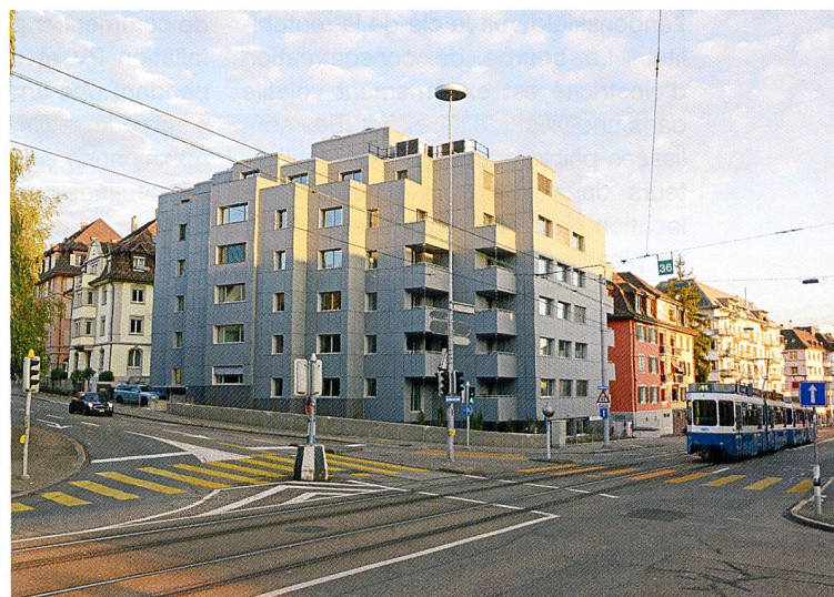
Les immeubles de la Hofwiesenstrasse avant rénovation (en haut) et après rénovation (en bas).

réduire via une optimisation des fenêtres et de la hauteur des étages. Et les coopératives d'habitation qui souhaitent rénover des lotissements entiers peuvent compter sur un effet d'échelle: si trois, quatre ou cinq immeubles d'une même typologie doivent être rénovés avec des façades actives, elles reviennent nettement moins cher.