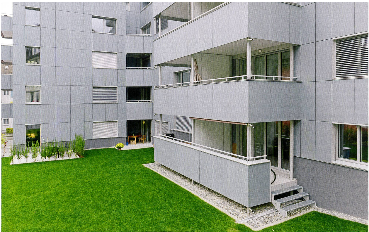
La cour intérieure, avec ses façades et balcons équipés de modules de verre actifs.

dans le bain de la rétribution unique ne pourront pas vendre leur électricité à Swissgrid en couvrant leurs frais. Mais ils disposeront d'électricité en auto-consommation. Et c'est là qu'Eric Langenskiöld voit la clé de la rentabilité: «La courbe de consommation d'électricité est extrêmement volatile dans une villa. Mais ces courbes sont lissées par le grand nombre d'utilisateurs dans le cas d'immeubles de location ou de lotissement entiers, et les pics de consommation sont compensés.» L'autoconsommation d'énergie solaire d'une villa peut avoisiner les 30-40%, avec une batterie de stockage on peut monter jusqu'à 60%. Selon Basler & Hofmann, cette valeur pourrait encore augmenter de