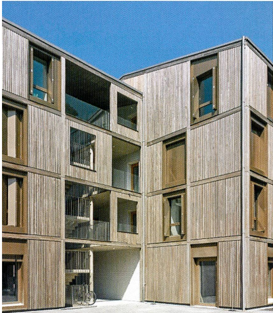
Les nouvelles réalisations (Rigaud, par la Codha, inauguré ce printemps) visent des consommations toujours moins importantes.

mal, et finalement, finissait par augmenter la température, et donc la consommation.» De guerre lasse! Et chacun d'espérer un nécessaire temps d'adaptation de quelques années plutôt que d'une génération.