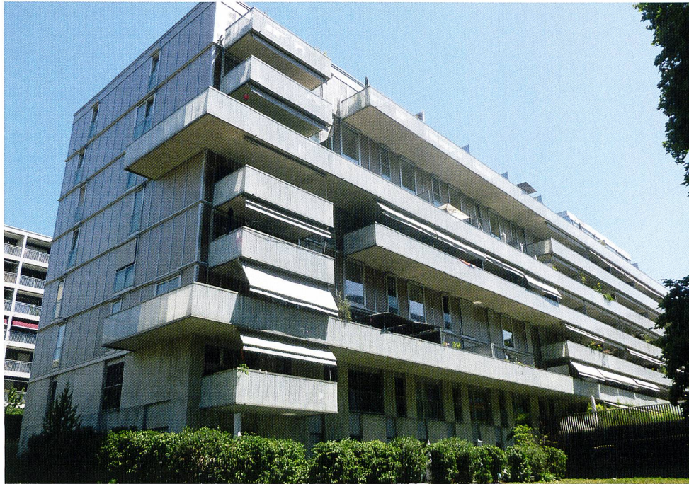
L'immeuble SCHG-Rhône-Arve Minergie P du Grand-Saconnex inauguré en 2012: une consommation trois fois inférieure à celle d'un immeuble traditionnel.

Conséquence de l'excellente isolation, et donc de la baisse très importante des dépenses d'énergie pour le chauffage des bâtiments, c'est le montant nécessaire au chauffage de l'eau sanitaire qui prédomine désormais. Le rapport des coûts s'est pratiquement inversé: de \frac{2}{3} - \frac{1}{3} à \frac{1}{3} - \frac{2}{3} . Le premier bilan est là: les MO qui ont fait l'effort de construire des bâtiments bien isolés et, accessoirement, souvent alimentés par des sources d'éner-