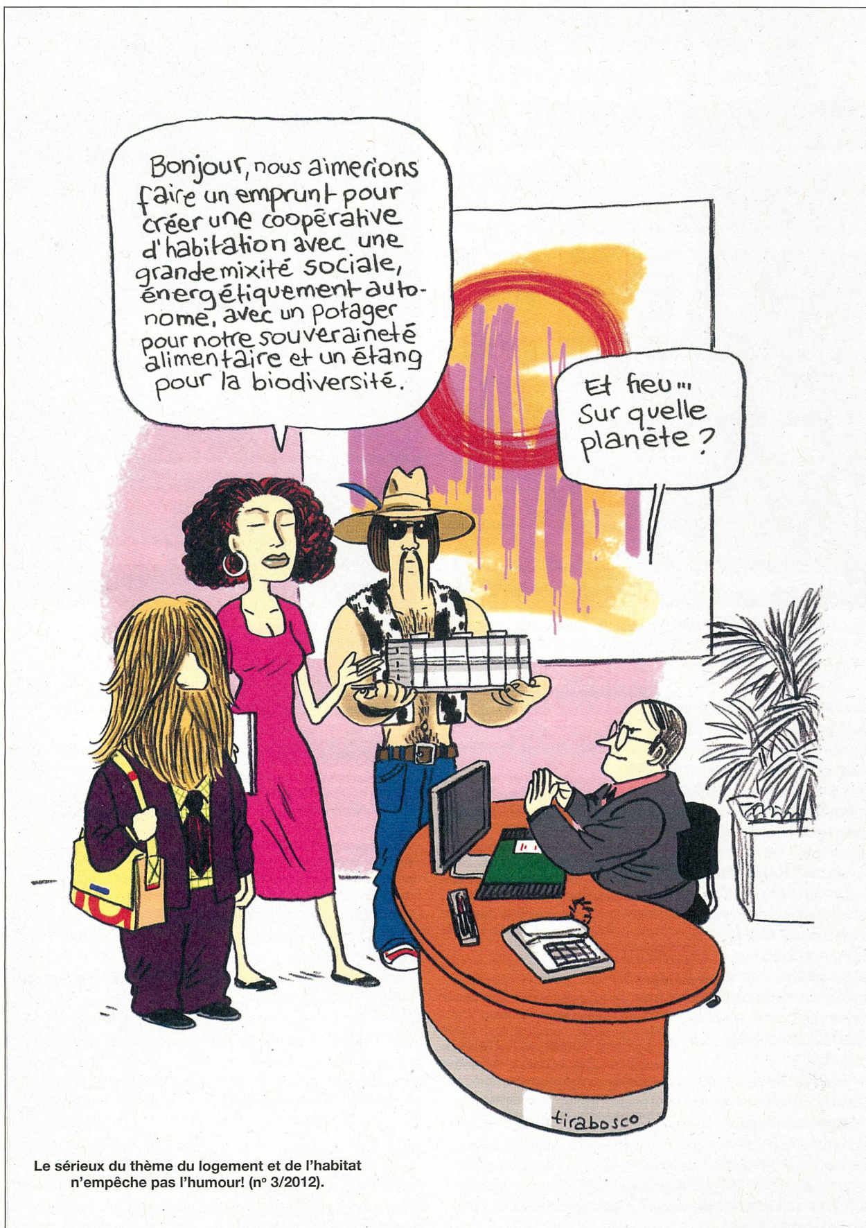
Le sérieux du thème du logement et de l'habitat n'empêche pas l'humour! (n° 3/2012).