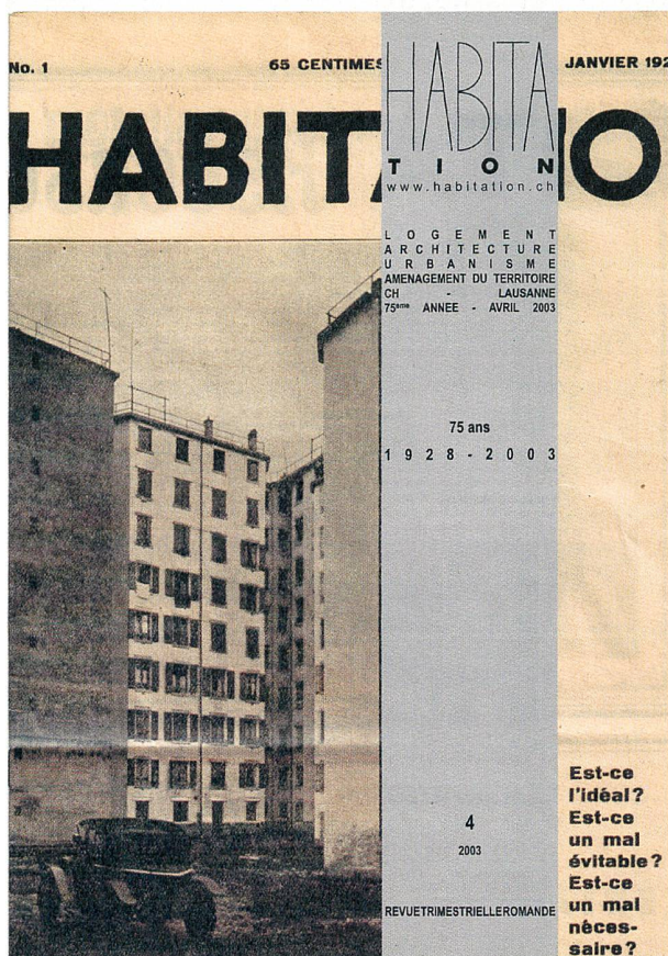
Couverture de Habitation 4/2003, 75 ans (1928-2003) de la revue.

Mais l'arrivée de l'impression en couleurs va chambouler le secteur des arts graphiques. Une vraie révolution pour ce secteur, qui s'adaptera, mais hélas des entreprises renommées disparaîtront. Toutes les revues se mettent