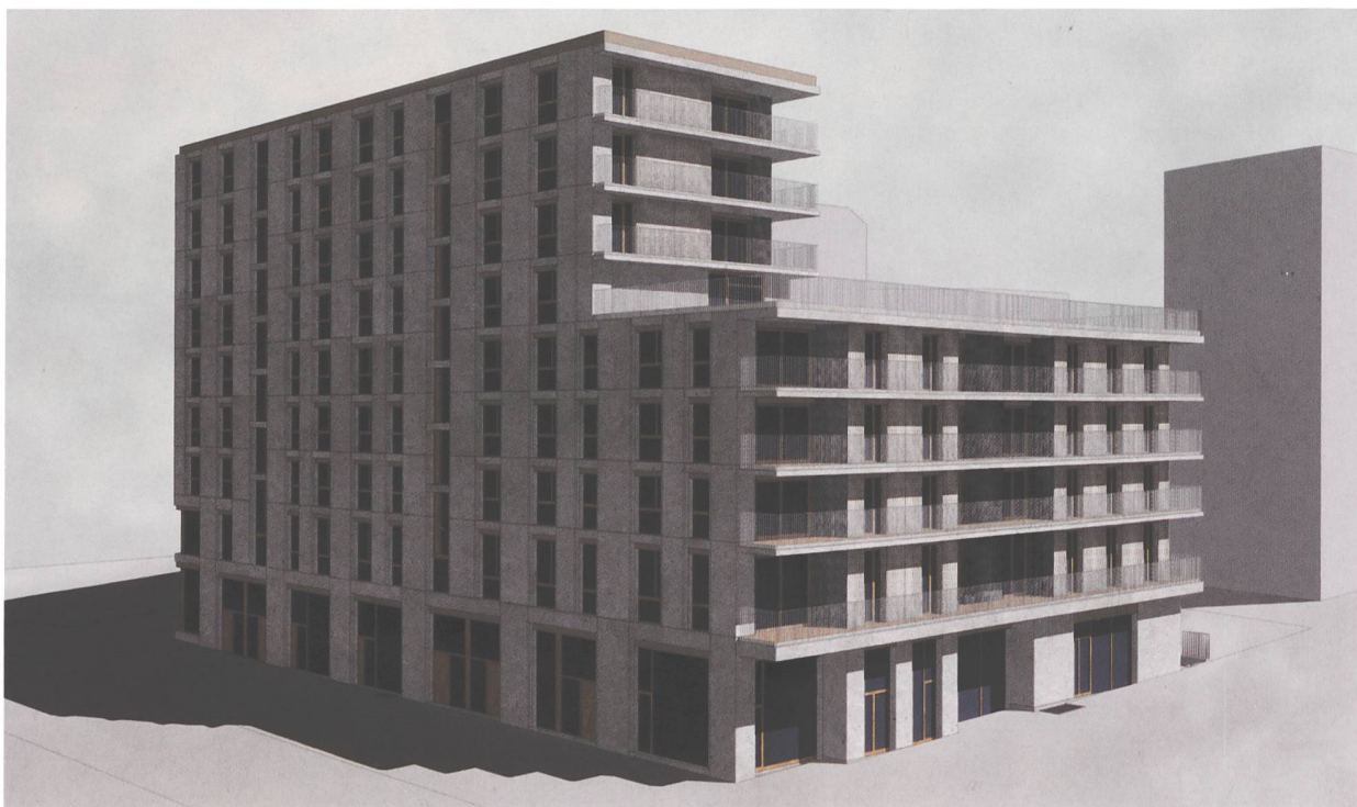
Le projet du Bled.