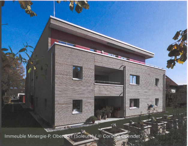
Immeuble Minergie-P, Oberdorf (Soleure)