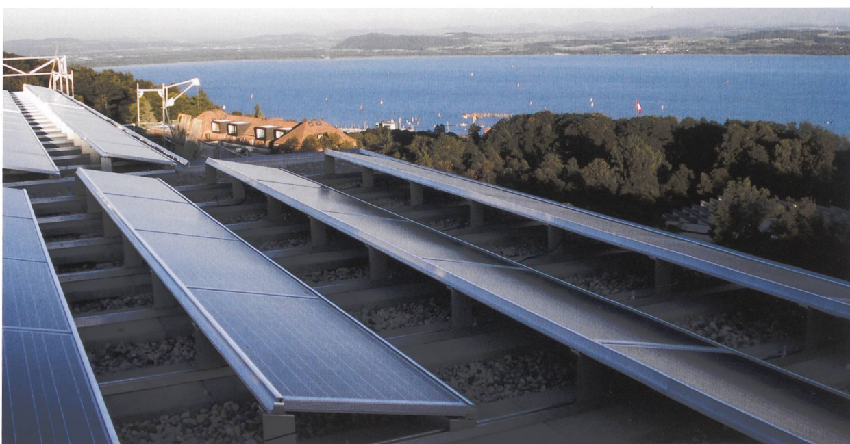
Le toit de l'immeuble des Acacias est recouvert de panneaux solaires photovoltaïques et thermiques depuis 2010.