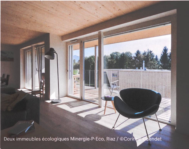
Deux immeubles écologiques Minergie-P-Eco, Riaz