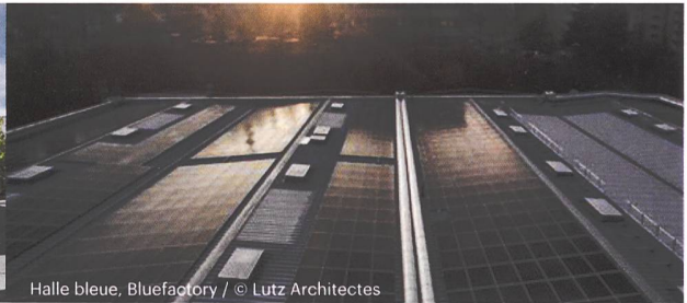
Halle bleue, Bluefactory / © Lutz Architectes

« Lutz Architectes conçoit les espaces bâtis d'aujourd'hui selon les exigences de demain »