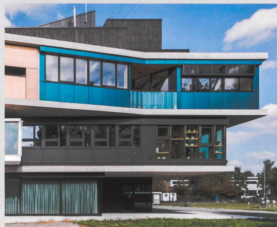
Façade sud de l'unité SolAce au NEST à Dübendorf équipée de panneaux solaires photovoltaïques colorés (Kromatix) / Lutz Architectes, EPFL.

Les façades possèdent un important potentiel pour l'exploitation de l'énergie solaire. Si l'on considère que l'exigence principale posée aux bâtiments du futur sera d'être autonome en énergie, il est nécessaire de les exploiter, car les toits n'offrent pas toujours les surfaces suffisantes pour produire l'énergie nécessaire au fonctionnement d'un bâtiment. C'est pourquoi le laboratoire du LESO à l'EPFL a développé, en collaboration avec Lutz Architectes Sàrl, spécialiste des bâtiments à haute performance énergétique, l'unité de recherche SolAce dans le bâtiment du NEST à Dübendorf.