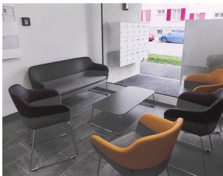
Petit salon où l'on cause en attendant le facteur...

Depuis l'entrée en vigueur en janvier 2018 de la nouvelle loi sur l'énergie, il est en effet désormais possible de faire bénéficier directement les locataires d'un immeuble ou de deux immeubles voisins de l'énergie électrique produite sur place, sous forme d'autoconsommation. «Grâce à nos panneaux photovoltaïques, nous couvrons environ 40% de nos besoins annuels en électricité! Et nous les facturons à environ 18 centimes le kWh à nos locataires», se réjouit Bernard Jaquet. Le reste étant fourni par les ser-