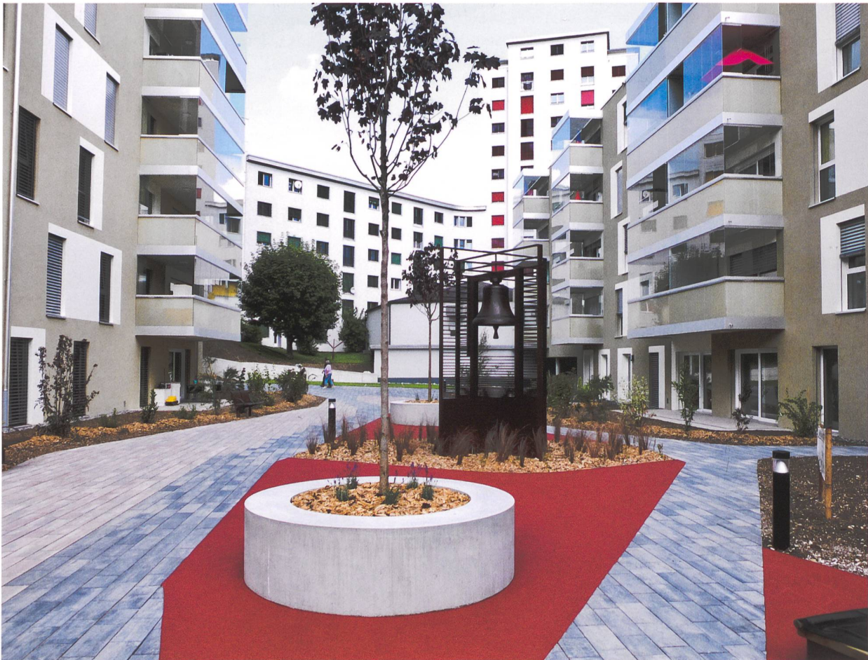
La cour entre les deux immeubles et le monument à la cloche.

Même au paradis, le diable est dans les détails, c'est bien connu. Et certains détails ont été particulièrement bien soignés par nos deux maîtres d'ouvrage. Comme par exemple le local à vélos de l'immeuble de la Fondation Rencontre, où des prises électriques permettent de