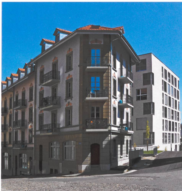
Immeubles en ville de Fribourg

Le 3 e Forum du logement se propose d'appréhender la thématique de l'adéquation entre l'offre et la demande en matière de logement sous divers angles. Outre les réflexions liées aux aspects statistiques par le biais de