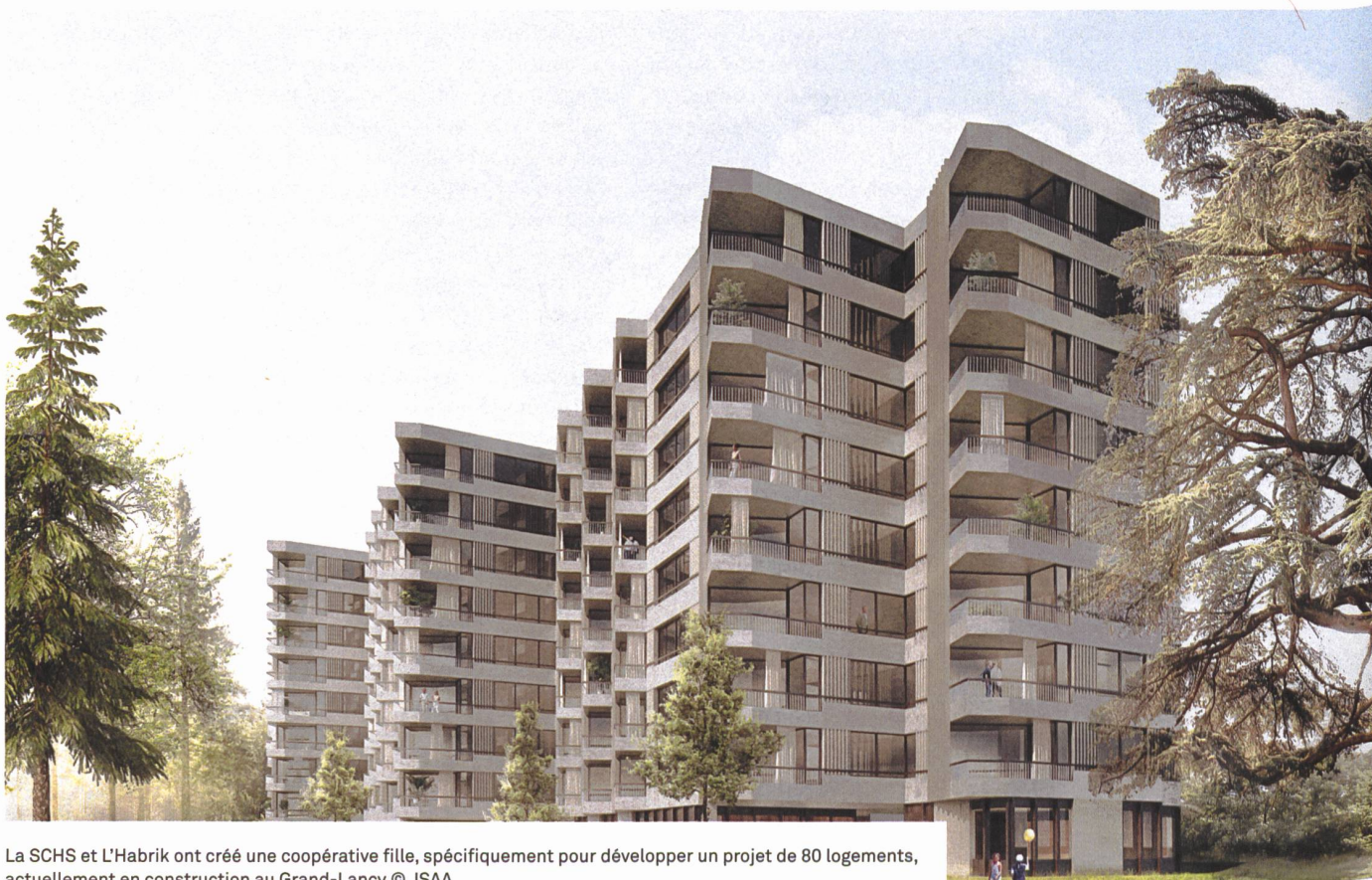
La SCHS et L'Habrik ont créé une coopérative fille, spécifiquement pour développer un projet de 80 logements, actuellement en construction au Grand-Lancy

Cette dernière souhaitait privilégier pour ses logements des coopérateurs également engagés dans les arcades du rez. «Nous avons rencontré des personnes et des structures intéressées par notre projet. Malheureusement, la temporalité de