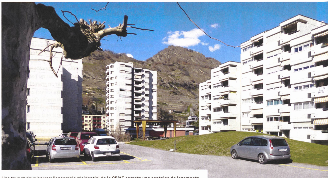
Une tour et deux barres: l'ensemble résidentiel de la CIVAF compte une centaine de logements.

alors que le séjour et la cuisine habitable avec balcon regardent vers l'ouest. Il n'y a pratiquement pas d'ouvertures vers le nord, ni vers le sud d'ailleurs, probablement parce que la parcelle borde le chemin de fer et, au-delà, un aéroport civil et militaire. La configuration de la tour, un peu plus éloignée des rails, est différente puisque seul son côté nord ne compte presque pas de fenêtres.