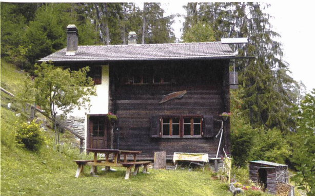
Le mayen bâti en 1937 a été rehaussé d'un étage il y a une quarantaine d'années. Il sert de résidence secondaire rustique à la belle saison, mais n'accueille plus de bétail.