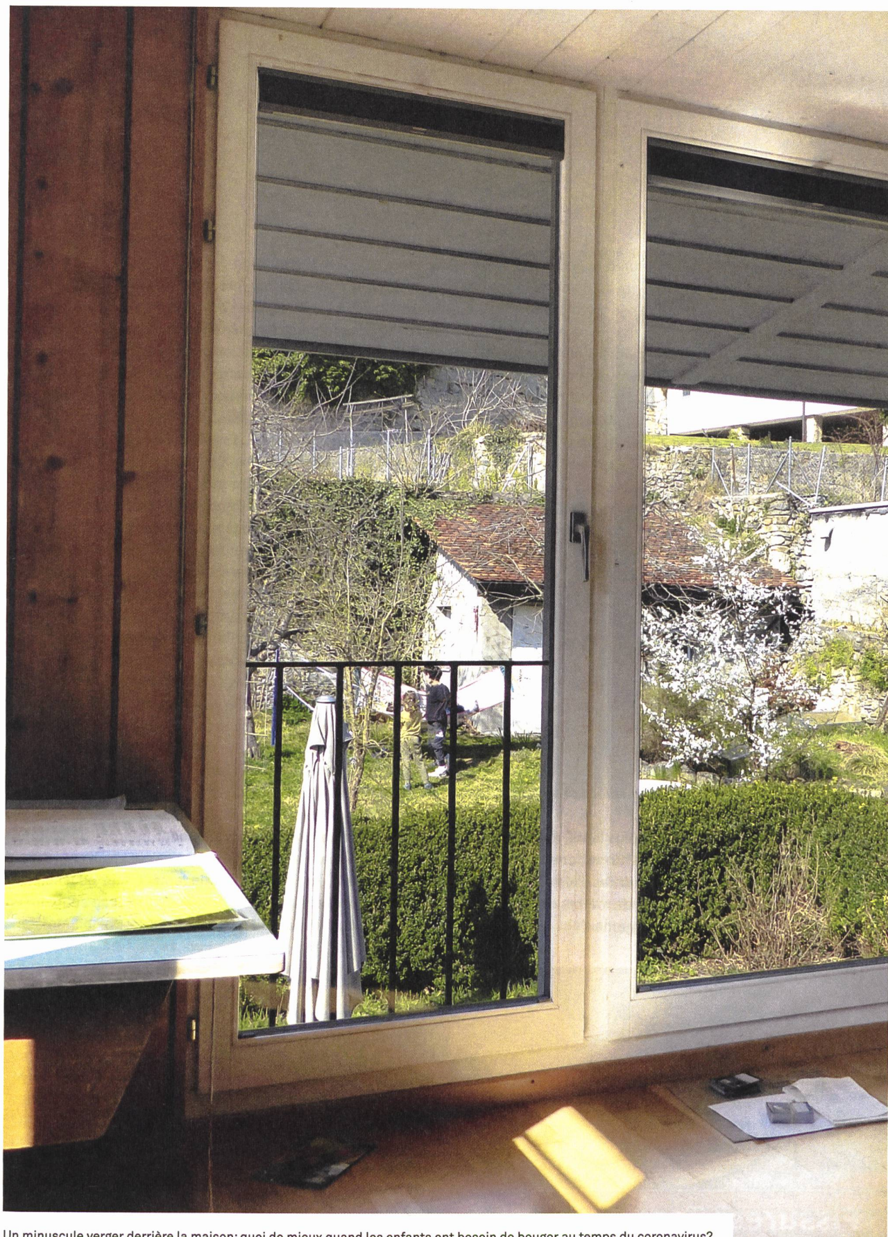
Un minuscule verger derrière la maison: quoi de mieux quand les enfants ont besoin de bouger au temps du coronavirus?