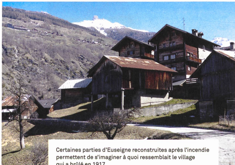
Certaines parties d'Euseigne reconstruites après l'incendie permettent de s'imaginer à quoi ressemblait le village qui a brûlé en 1917.