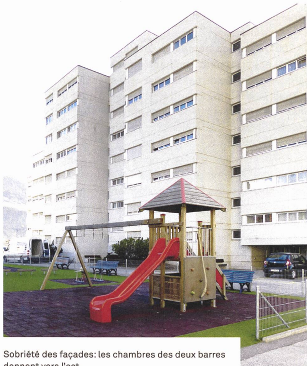
Sobriété des façades: les chambres des deux barres donnent vers l'est.

plus souvent femme au foyer. Ce sont les années 1970, les Trente Glorieuses touchent à leur fin.