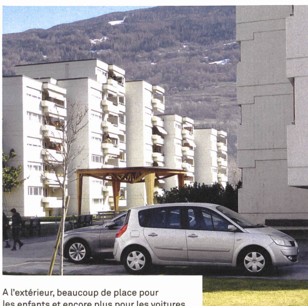
A l'extérieur, beaucoup de place pour les enfants et encore plus pour les voitures.

La première chambre que je loue à Fribourg me coûte presque autant que ce que ma famille déboursait à la CIVAF. Durant les années qui suivent, trois paramètres déterminent mes choix résidentiels: je veux payer le moins possible, vivre au centre-ville et cohabiter avec des gens sympas. La taille de la salle de bain m'intéresse aussi peu que la date de la dernière rénovation. Ces critères restent les mêmes pendant mes premières années de vie professionnelle. En douze ans, je déménage huit fois. On nous dit sédentaires, mais nous sommes des nomades.