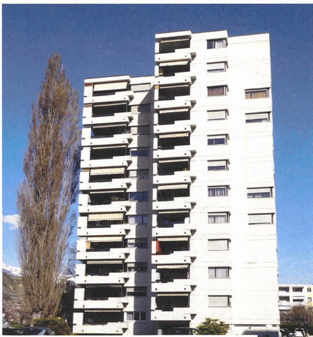
En cinquante ans, le peuplier a eu le temps de dépasser le onzième et dernier étage de la tour.