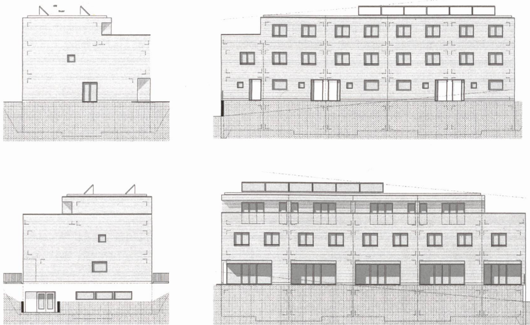
Ebauche d'un projet de bâtiment de cinq logements jamais réalisé faute de parcelle disponible (conception: Claude Gaillard, architecte).

Les travaux commencent à l'automne 2011, alors que nous vivons déjà dans notre nouvelle habitation. L'accès intérieur au troisième étage est fermé de manière à éviter les poussières, mais le bruit ne se préoccupe pas de ce genre de barrières... Les séances de chantier ont lieu le mardi à onze heures. Ma femme est absente. Notre fils aîné n'a pas six ans, il rentrera de l'école un peu avant midi et le repas devrait être prêt à ce moment-là. Je tiens le cadet dans mes bras tout en discutant avec l'architecte et les ouvriers. Mes deux autres enfants se