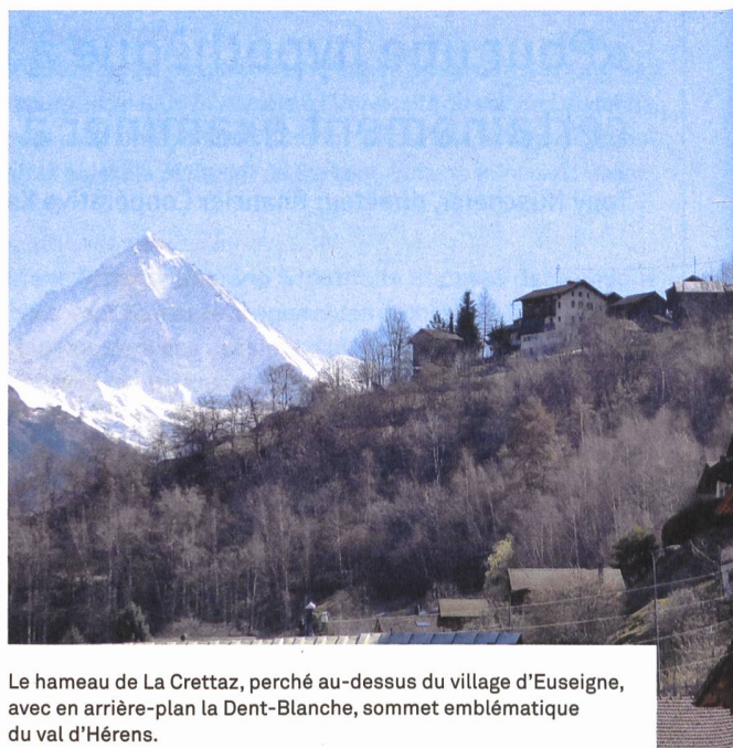
Le hameau de La Crettaz, perché au-dessus du village d'Euseigne, avec en arrière-plan la Dent-Blanche, sommet emblématique du val d'Hérens.