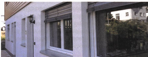
Le système complet Implio de GUTEX assure un raccord des fenêtres et portes qui résiste durablement au vent et à la pluie battante.

La construction en bois du maître d'ouvrage Walter Fähr est située dans un environnement calme et en hauteur, au bout d'une impasse. Cet immeuble de trois étages héberge trois appartements spacieux en copropriété et locatifs avec une surface habitable allant jusqu'à 160 mètres carrés. Lors de la construction, on a accordé une grande attention à des matériaux haut de gamme, les plus naturels et écologiques possible. Le parquet en chêne huilé, le crépi naturel respirant, l'isolation en fibres de bois et le chauffage par sonde géothermique avec refroidissement passif ne sont que quelques éléments. Les pièces sont équipées de grandes fenêtres et sont donc baignées de lumière naturelle.