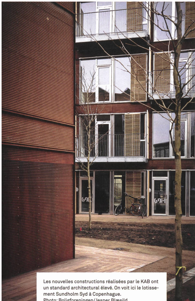
Les nouvelles constructions réalisées par le KAB ont un standard architectural élevé. On voit ici le lotissement Sundholm Syd à Copenhague.

D'une part, notre parc immobilier de 70 000 logements fait de nous un client important dans le secteur de la construction, avec d'incessants nouveaux mandats. Nous allons investir ces quatre prochaines années entre 1,3 et 2 milliards de francs. D'autre part, nous avons développé un modèle qui démarre dès les appels d'offres. Des équipes d'entrepreneurs, d'architectes et d'ingénieurs peuvent y participer – et pas seulement pour un seul projet. Nous participons activement au sein de ces équipes et nous collaborons ensemble à long terme – tout