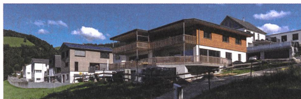
Les immeubles modernes s'alignent sur la colline de Lichtensteig. La construction en bois apporte une touche particulière au tableau.

Visuellement, la nouvelle construction compacte avec son toit plat largement en porte-à-faux et ses terrasses, le rez-de-chaussée recouvert de crépi blanc et l'étage supérieur habillé de bois se différencie. Le type de construction naturelle avec beaucoup de bois donne son caractère à l'ensemble de la construction : la cons-