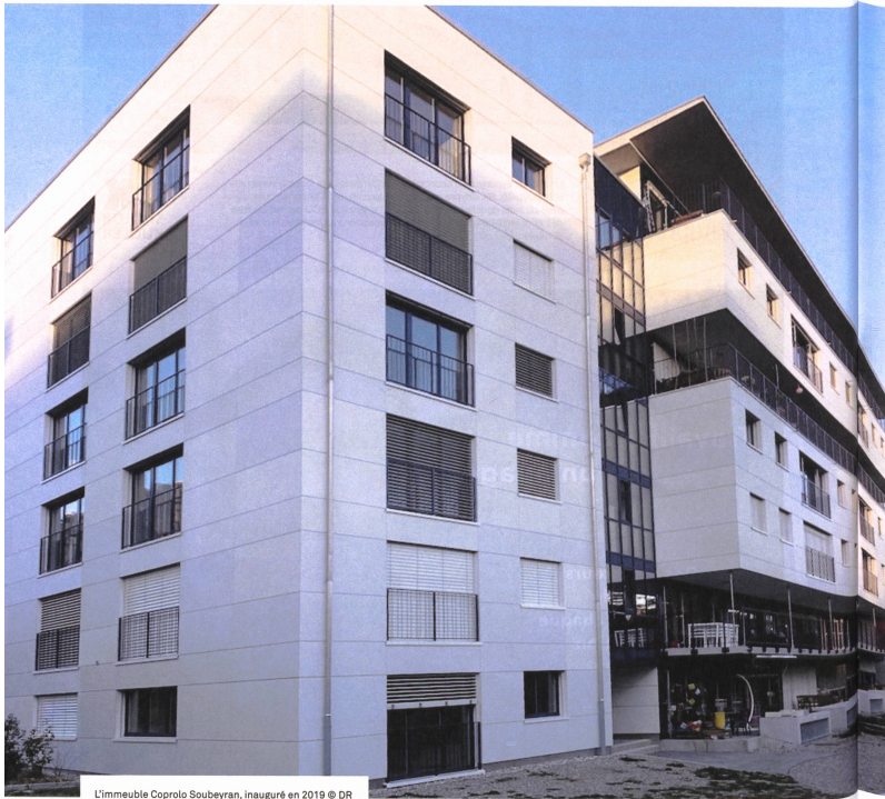
L'immeuble Coprolo Soubeyran, inauguré en 2019

Depuis 1970, la Société coopérative pour la promotion du logement a acquis, investi ou réalisé huit bâtiments, pour un total de 328 logements. En 2020, elle travaille sur deux projets de construction et une surélévation qui doivent générer une soixantaine de logements de plus. Pour commencer!