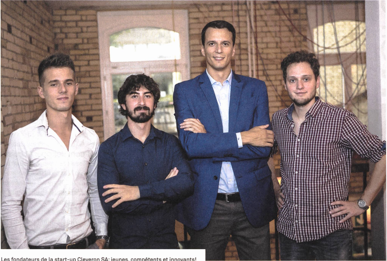
Les fondateurs de la start-up Cleveron SA: jeunes, compétents et innovants!