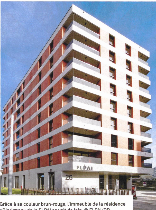
Grâce à sa couleur brun-rouge, l'immeuble de la résidence «Bjorkman» de la FLPAI se voit de loin.

Chacun des 64 logements de trois pièces «genevois» dispose d'une pièce centrale, d'une cuisine entièrement équipée, d'une chambre à coucher et d'une salle de bain, de même qu'un balcon-loggia. Tous les logements sont aux normes SIA 500 pour les personnes à mobilité réduite ou en fauteuil roulant. Les boutons de commande de la cuisinière sont sur le côté (et non pas sur la surface avec des touches tactiles). «Les fenêtres sont larges car nous privilégions la lumière, et l'éclairage intérieur a été soigneusement pensé. Tout y est aménagé pour le confort des locataires, avec la TV et le WiFi installés dans