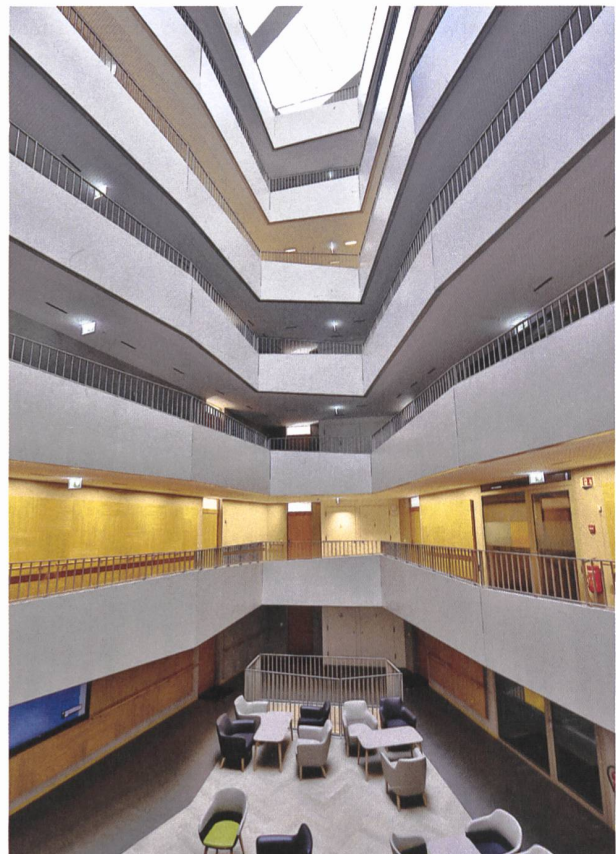
Le vaste puits de lumière relie la verrière en toiture au hall d'accueil et laisse deviner la forme en pentagone irrégulier de l'immeuble.

Dans les coursives, le sol est en béton ciré et permet de marcher sans crainte de glisser. Les mains courantes et toutes les portes sont en bois. Au-dessus, une imposte vitrée permet, lorsque l'on marche dans la coursive, de voir les lumières dans les logements: «C'est rassurant de savoir qu'on est entouré de personnes qui sont chez elles» souligne M. Cuttat. L'éclairage dans les coursives a également été pensé en fonction