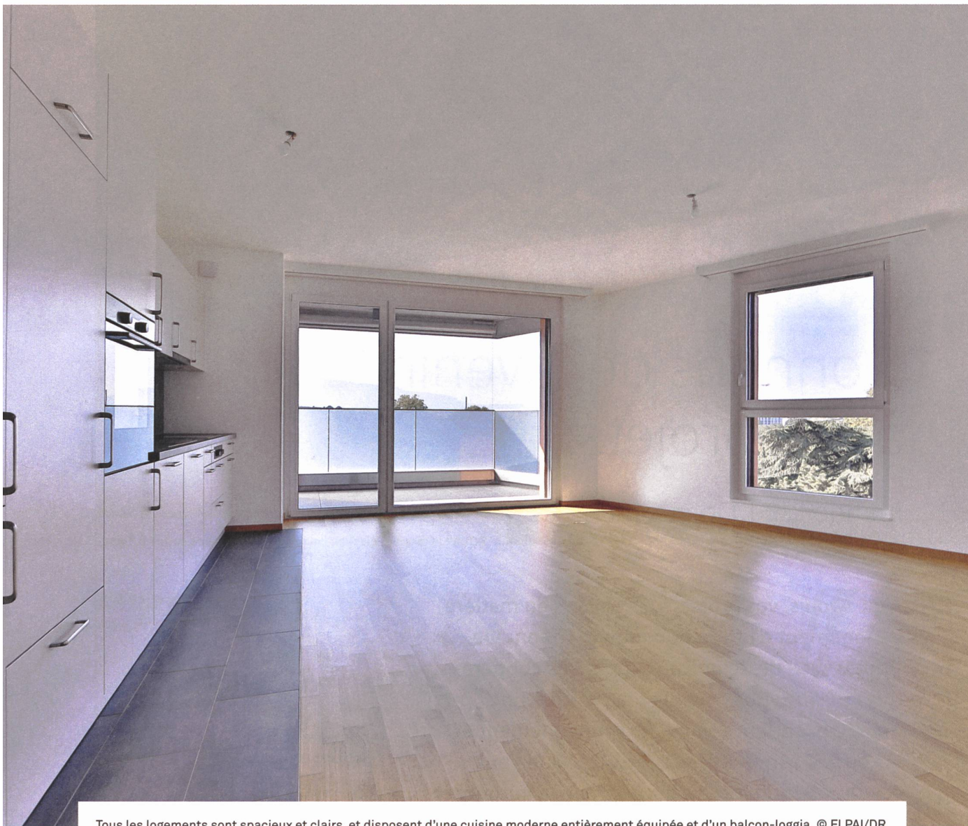
Tous les logements sont spacieux et clairs, et disposent d'une cuisine moderne entièrement équipée et d'un balcon-loggia.