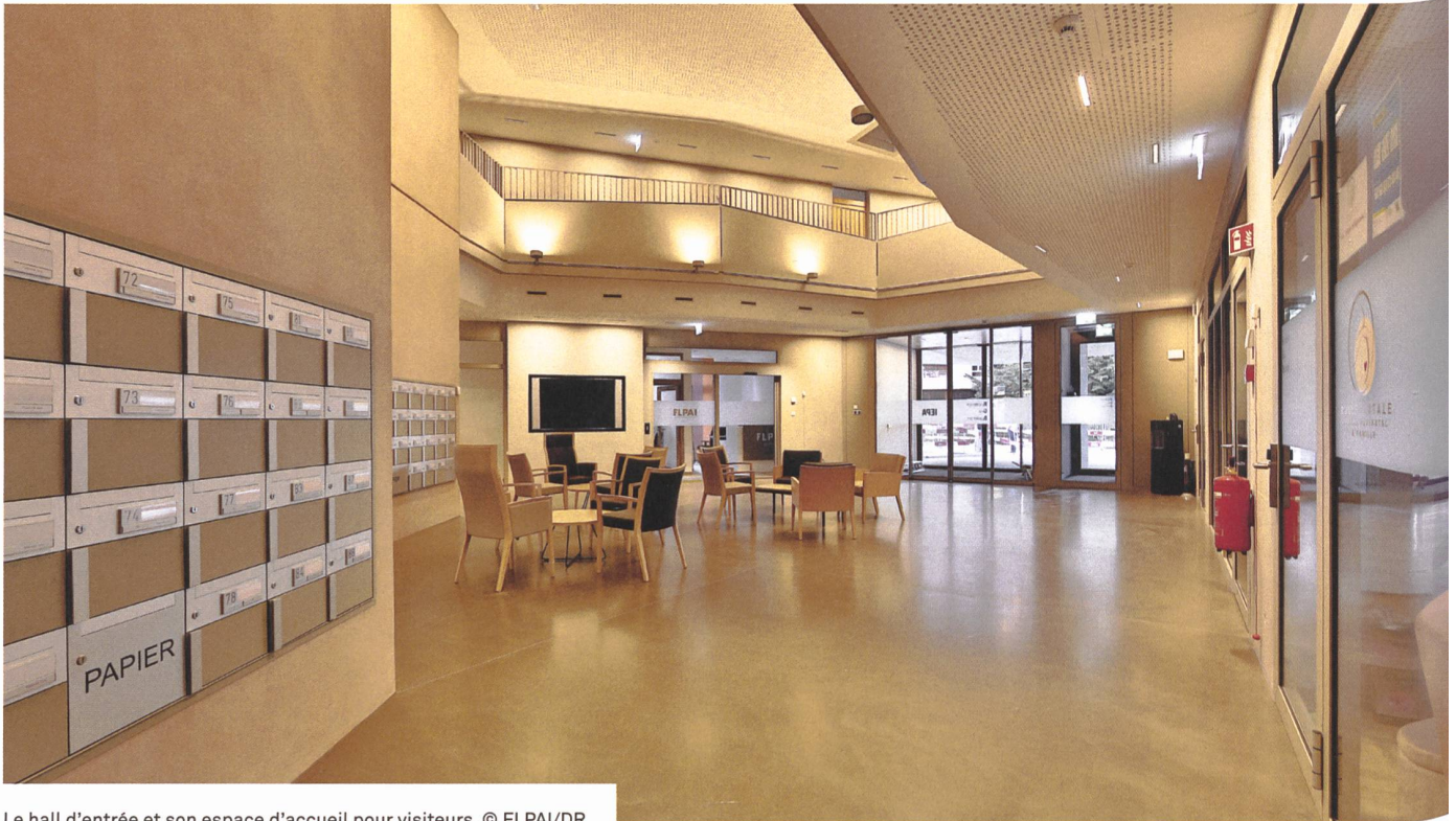
Le hall d'entrée et son espace d'accueil pour visiteurs.