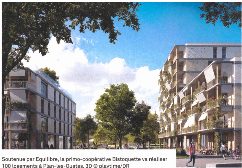
Soutenue par Equilibre, la primo-coopérative Bistoquette va réaliser 100 logements à Plan-les-Ouates. 3D © playtime/DR