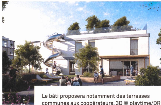
Le bâti proposera notamment des terrasses communes aux coopérateurs. 3D © playtime/DR

promues par Equilibre. Un bâti Minergie exigeant réalisé avec un maximum de matériaux naturels, garants notamment d'une très grande qualité de l'air à l'intérieur. Un système de traitement des eaux usées – toilettes y compris – sur le site. Un grand nombre de salles et d'espaces communs. Un désengagement volontaire et formel du véhicule à moteur individuel, avec parc de véhicules communs et système de réservation interne – 30 places de parking pour 100 appartements sont prévues. Sans oublier des chantiers participatifs.