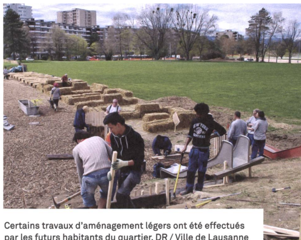
Certains travaux d'aménagement légers ont été effectués par les futurs habitants du quartier.

Nous prévoyons de proposer tous les types de logements, et préconisons des 4 pièces (entre 80 et 90 m 2 ) et des 5 pièces efficaces (entre 100 et 110 m 2 ) afin qu'ils restent financièrement abordables, notamment pour loger les familles, qui