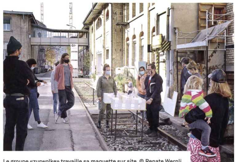
Le groupe «zurwolke» travaille sa maquette sur site.

Il s'agissait non seulement d'habiter ensemble dans des grandes halles, mais également d'y œuvrer, d'y travailler et d'y organiser des événements culturels et politiques, et bien sûr de faire la fête. Les halles avaient donc été aménagées