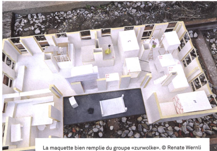
La maquette bien remplie du groupe «zurwolke».

pour répondre à divers besoins, sans répartition conventionnelle des espaces et parfois de manière assez aventureuse, avec des couchettes et des nids munis d'échelles de corde, et qui changeaient sans cesse de configuration. Selon Mätti, les éléments mobiles sur roulettes se sont avérés particulièrement pratiques. «Il suffit de les pousser où l'on veut quand on a besoin de faire de la place pour un événement ou pour une grande fête. Les rocares ont également permis d'éviter aussi que certains ne s'accaparent les meilleures places.» Des idées qui ont fait leurs preuves et qui ont été adaptées à la Zollhaus par «zurwolke».