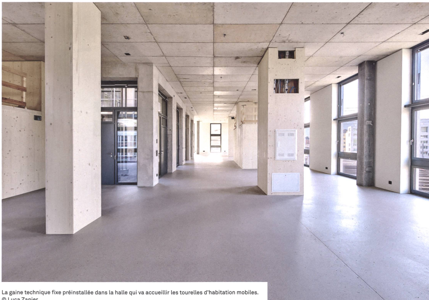
La gaine technique fixe préinstallée dans la halle qui va accueillir les tourelles d'habitation mobiles.