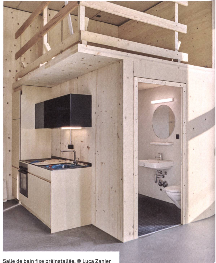
Salle de bain fixe préinstallée.

obtenu d'autorisation de construire. Comme par exemple les espaces de séjour en surélévation, car la hauteur des halles de quatre mètres n'autorise que des constructions sur un niveau. Le financement posait également problème: l'auto-construction est bien plus coûteuse que l'on ne pourrait s'imaginer. Une cuisine individuelle peut par exemple coûter bien plus cher qu'un modèle standard bénéficiant de rabais de quantité. En plus des parts sociales de 69 000 francs, il a fallu compter avec des investissements à six chiffres par grande halle.