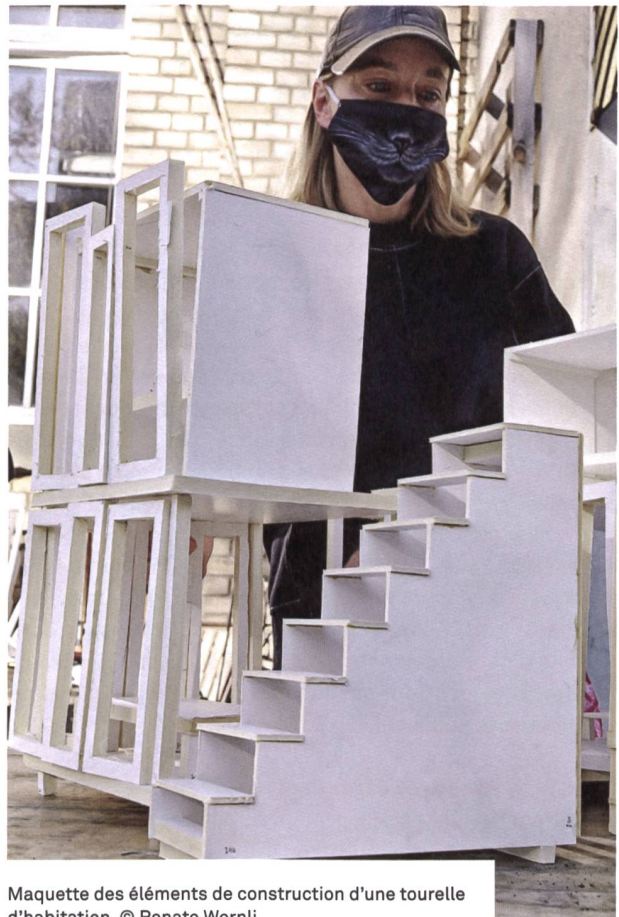
Maquette des éléments de construction d'une tourelle d'habitation.