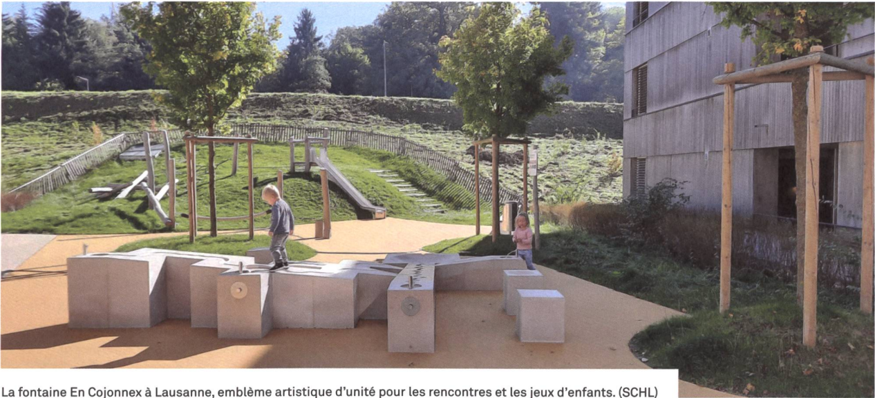
La fontaine En Cojonnex à Lausanne, emblème artistique d'unité pour les rencontres et les jeux d'enfants. (SCHL)

label Minergie-P-A-Eco sont évidemment plus élevés que pour un immeuble standard, mais en qualité de grande coopérative d'habitation, nous tenons à continuer de jouer un rôle de pionnier en la matière – et de toute façon, cette plus-value est un bon investissement pour l'avenir, tant pour l'aspect écologique de notre patrimoine que pour la durabilité de l'immeuble et pour les expériences que nous pourrions en tirer. Ce genre d'immeubles nécessite d'ailleurs un certain apprentissage à l'usage, que nous devons apprendre et appliquer à nos futurs sociétaires-locataires sensibles à l'environnement. Il en va d'ailleurs de même pour tous les immeubles à haute valeur énergétique que nous avons déjà construits et dans lesquels les habitant-e-s signent une charte de comportement les engageant à respecter les nécessités d'usage propres à ce genre de bâtiments. Nous venons aussi de publier une petite brochure, «La bonne énergie», afin de familiariser nos locataires avec les bonnes pratiques pour économiser l'énergie dans leur logement.