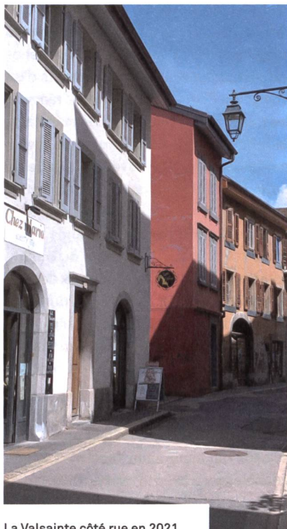
La Valsainte côté rue en 2021...