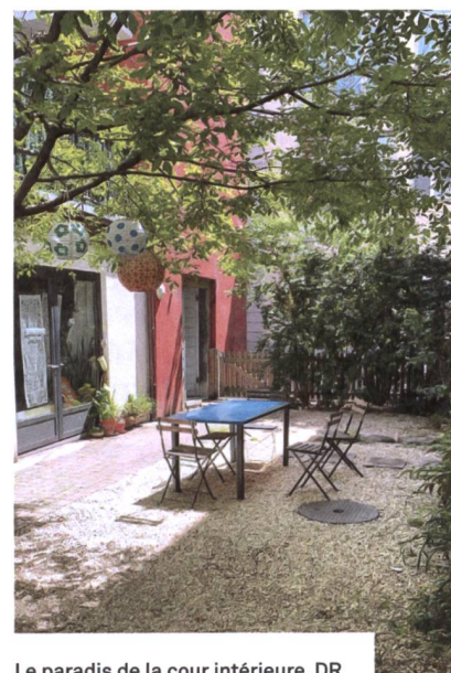
Le paradis de la cour intérieure. DR