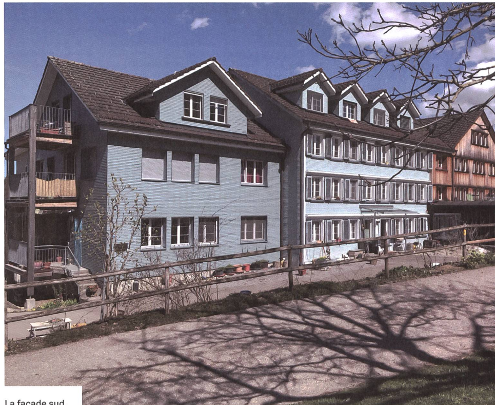
La façade sud.

La coopérative Wogeno-Mogelsberg a défini cinq valeurs sur lesquelles elle base son style de vie: écologie, communauté, responsabilité, activités sociales et d'entraide, éthique. Elle est autogérée et fonctionne sur un mode participatif. D'un point de vue organisationnel, les différentes structures mises en place au départ ont fait leurs preuves. Toutes les décisions importantes sont prises par une assemblée générale qui a lieu une fois par mois et un comité est en charge de la coordination, des aspects adminis-