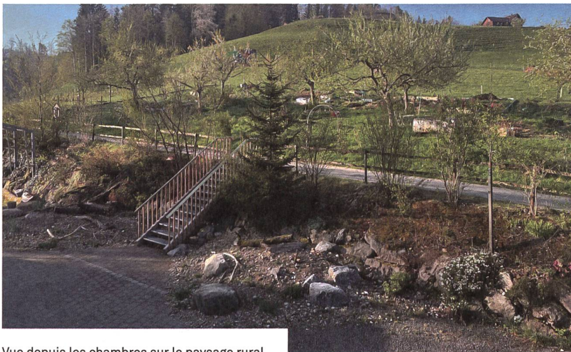
Vue depuis les chambres sur le paysage rural.

Pour en savoir plus: www.wogeno-mogelsberg.ch