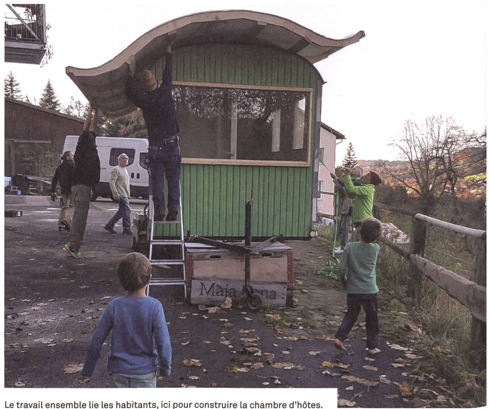
Le travail ensemble lie les habitants, ici pour construire la chambre d'hôtes.