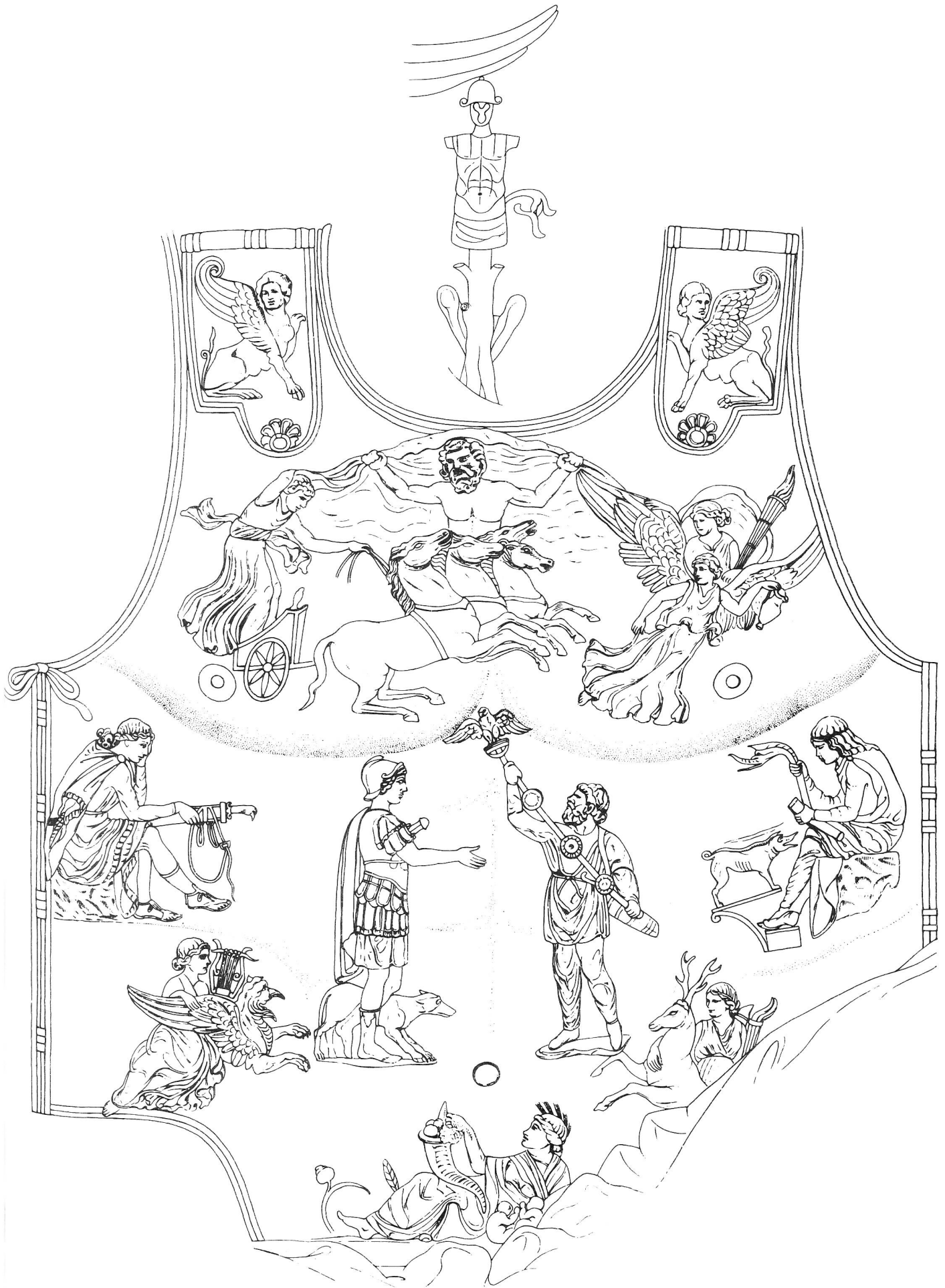
Abb. 1 Augustus von Prima Porta, Panzerrelief, Zeichnung B. Stucky-Böhms