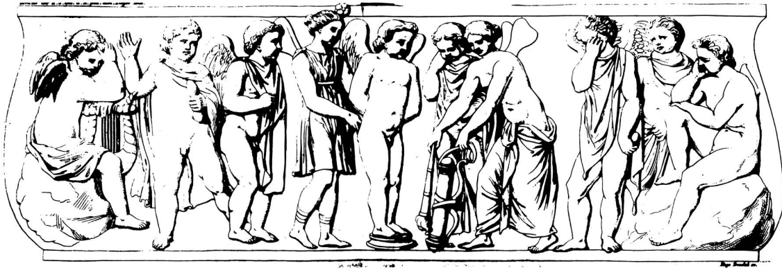
Abb. 2: Sarkophag Berlin. Nach Jahn.

Für die Anfänge des Gefesselten, der am Boden sitzt, gelten die für den Stehenden gemachten Beobachtungen 26 . Die sitzende Haltung des Eros machte das Motiv ungeeignet für eine selbständige Formulierung in Stein. So ist mir keine Marmorstatuette dieses Typus bekannt 27 . Er lebte in römischer Zeit ausschliesslich in der Glyptik weiter (1. B 28–32).