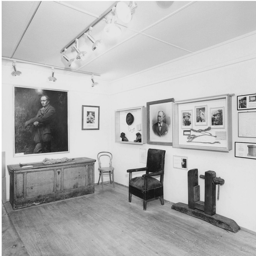
Abb. 1: Das gerissene Seil der Erstbesteigung unter Whymper als «unic-selling-proposition» wie das Matterhorn selbst: Jährlich besuchen um die 20'000 Personen das Alpine Museum in Zermatt, ohne dass dieses speziell um die Gunst des Publikums werben muss.

den. Das bei der Erstbesteigung des Matterhorns unter Edward Whymper gerissene Bergseil und andere Ikonen des Alpinismus konnten von der Öffentlichkeit unter Führung des alten Bergführers Rudolf Taugwalder besichtigt werden. Die eigentliche Museumsgründung dürfte um 1904 erfolgt sein, 1958 wurde die private Sammlung in das Alpine Museum überführt.