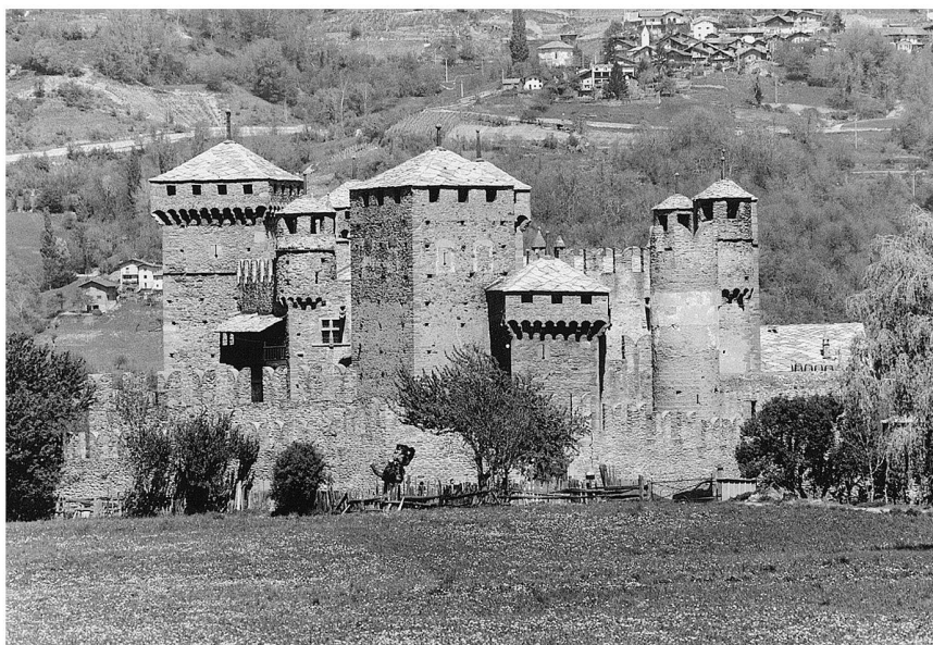
Fig. 2: Fénis: castello. Veduta da sud.

mettersi in rapporto con quelli che si sapeva condotti negli stessi anni al castello di Fénis dal fratello maggiore di Amedeo, Bonifacio I di Challant il maresciallo.