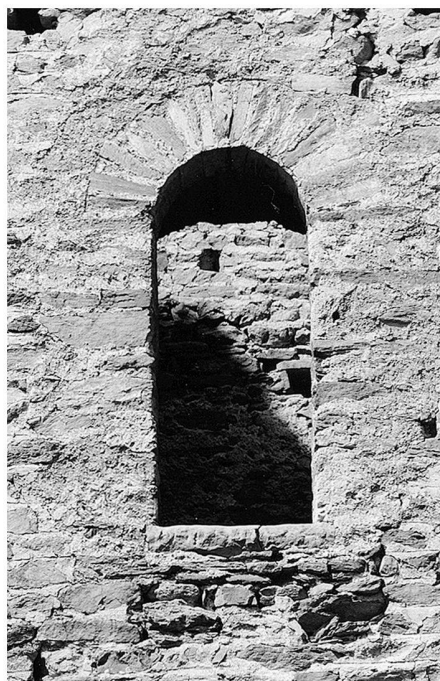
Fig. 9: Saint-Denis: castello di Cly. Porta di accesso al torrione.

campagne archeologiche, le ricerche sui castelli e più in generale sull'architettura tardomedievale valdostana non solo si stiano rivitalizzando, ma sembrano sul punto di compiere un vero e proprio salto qualitativo.