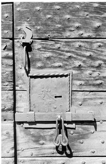
Fig. 7: Saint-Pierre: castello Sarriod de la Tour. Serratura quattrocentesca.

zoccolo al corpo superstite del donjon. Di questi elementi esterni esistono però ancora alcuni elementi e uno, in particolare, non mi sembra essere mai stato notato, a dispetto della sua notevole qualità.