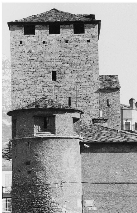
Fig. 4: Aosta: torre dei Balivi. Veduta da est.

ridionale della chiesa, fuori della chiesa stessa; testimonia di ampi interventi di restauro alle grange di Tarenzan e de Basis ; di continui rifacimenti delle barriere sulla Dora e sul Buthier; di lavori condotti da un lathomus tarentasiensis al monastero di Saint-Gilles di Verrès; fornisce la prima data fin qui sicura per la costruzione delle volte della Cattedrale, al 1495, quando Giorgio di Challant ordinava di pagare al canonico della Cattedrale Bartolomeo Pensa 100 fiorini per una crusiata , vale a dire una crociera della chiesa; soprattutto chiarisce molti termini relativi agli ampliamenti del priorato di Sant'Orso. Questo fin dalle prime pagine dei conti, vale a dire dall'inizio del 1494, sembra aver già avuto un assetto sostanzialmente identico a quello attuale. Gli unici lavori di ampliamento esterno consistenti sembrano relativi alla sopraelevazione della «camera alta della torre», vale a dire la camera superiore del corpo meridionale, e alla costruzione di una «camera nova» ad essa adiacente, sicuramente verso nord. Nel priorato esisteva poi una terrazza, le cui tracce sembrano ancora oggi individuabili nel sottotetto del corpo nord, verso est, cioè verso il cortile interno. L'acquisto di 2000 mattoni nel 1498, citando espressamente la realizzazione di finestre, dovrebbe essere relativo