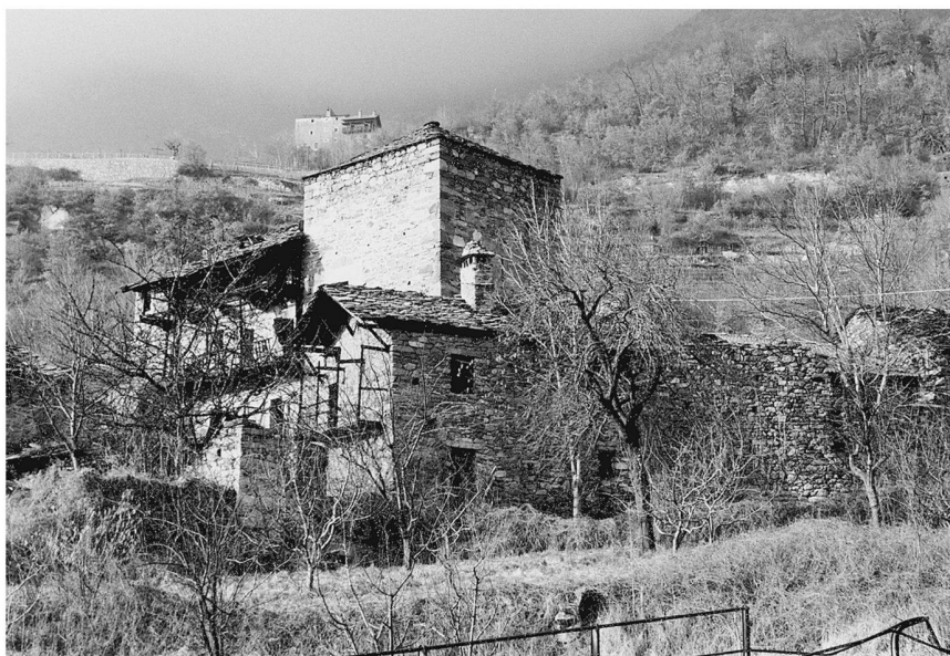
Fig. 1: Châtillon: torre e casaforte di Neran. Veduta da sud.

come il castello, passato ai Savoia dopo il 1242, fosse oggetto di una campagna di restauri negli anni compresi tra il 1278 e il 1284. Un gruppo di mastri tagliapietre, tra cui i conti citano Nicholaus , Nicholinus , Nichodus , Hodanyn , Vuillelmus di Chevrère e magister Gunterus , era impegnato soprattutto a costruire mura. Si cita una ravasia per la calce; si fa cenno ad un «muro nuovo» e poi si pagano dettagliatamente diversi tratti di cinta per un'estensione notevole: prima 20 tese, poi una tratta equivalente ad un pagamento di 31 lire (circa 25 tese), poi ancora sei tese, cinque tese e mezzo, un altro pagamento equivalente a circa 5 o 6 tese, 46 tese e tre quarti di muro merlato. In tutto almeno un centinaio di tese equivalenti a poco meno di 200 metri di sviluppo. Brevi notazioni sulla localizzazione di questi muri, «dalla cappella di San Michele alla porta di Aosta», «alla portella de glorieta», «dalla porta del ponte levatoio alla rupe de la Cropa» permettono di stabilire che si stava lavorando ad una cinta perimetrale esterna di dimensioni imponenti che faceva di Bard il più esteso complesso fortificato della regione. 3