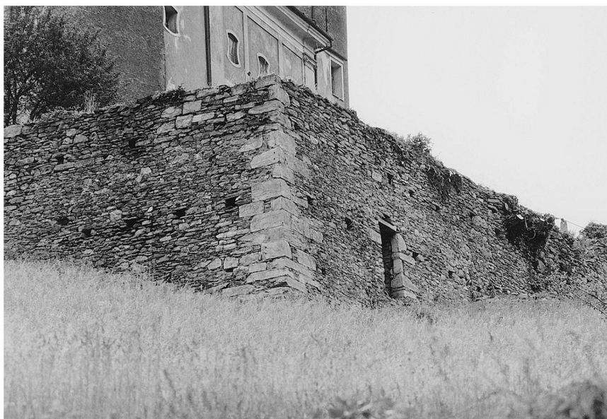
Fig. 6: Aymavilles: castello. Elemento superstite di una cinta muraria tardomedievale.

lavoro può permettersi di acquistare un edificio importante; che sui modelli culturali fornitigli dal suo signore decide di trasformarlo in una residenza di prestigio; che per fare ciò si rivolge ai capomastri e ai lathomi che aveva conosciuto al servizio di Bonifacio di Challant. Il tutto in un arco di tempo significativamente ristretto, tra il 1395 e il 1405.