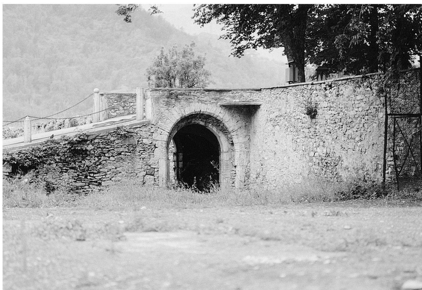
Fig. 5: Aymavilles: castello. Viale di accesso, resti di un doppio portale tardogotico.

per tipologia e modi esecutivi ad alcune porte aperte sui ballatoi del cortile di Fénis. Il recupero di questa porta è di estremo interesse perché la connessione formale con Fénis può essere rafforzata con dati documentari sicuri. I computa di Fénis citano infatti più volte, tra il 1393 e il 1395, il notaio Antoine Vaudan come stretto collaboratore di Bonifacio di Challant, incaricato di saldare i pagamenti ai lathomi ai carpentieri e agli artigiani. 19 Un documento del fondo Challant all'Archivio storico regionale testimonia come, nel 1400, il Vaudan acquistasse da Bonifacio di Challant proprio la turris de porta , 20 mentre un ultimo documento, recentemente registato da Gianni Thumiger nell'archivio capitolare della Cattedrale, è relativo «alle costruzioni che il notaio Antoine Vaudan sta facendo eseguire presso la turris Portae » nel 1404. 21