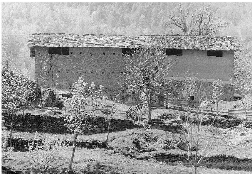
Fig. 3: Féris: castello. L'ala viridari vista da nord.

Aosta. È da questi materiali che sappiamo della presenza ad Aosta, sull'arco di un decennio, tra il 1420 e il 1430, di uno dei maggiori architetti sabaudi, Aymonet Corniaux. Sempre da questi materiali emerge anche inequivocabilmente il ruolo svolto dal grande scultore aostano Stefano Mossetaz nel settore dell'architettura civile e militare, sia alla stessa torre dei Balivi che al castello di Saint-Germain, che l'inetto Francesco di Challant era stato costretto a vendere ai Savoia. 11