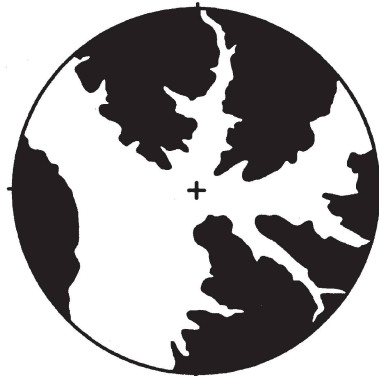
Abb. 1: Höhenlage des Stadtumkreises bei Städten am Adige. Stadtumkreis von 15 km Radius. Weiss: Gelände unter 1000 m ü. M., schwarz: Gelände über 1000 m ü. M.

Bozen/Bolzano Höhenlage der Stadt: 262 m ü. M. Vom Stadtumkreis unter 1000 m ü. M.: 47%