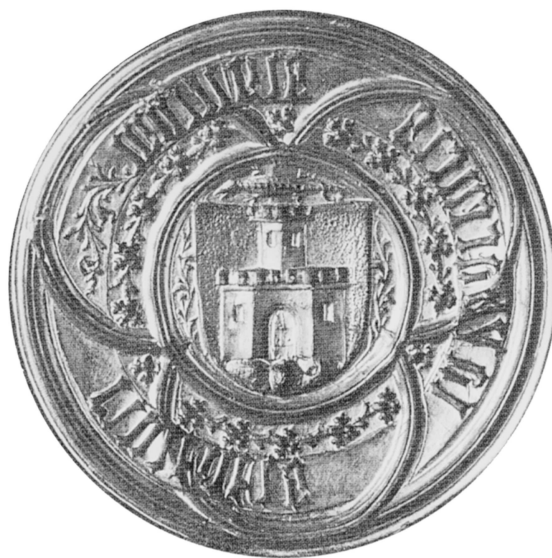
Abb. 5: Siegel von Ljubljana/ Laibach aus dem 15. Jahr- hundert.

Črnomelj/Tschernembl durch eine Feuersbrunst wurden ihr im Jahr 1457 von der Stadt Metlika/Möttling die gleichen Rechte bestätigt (wie Landstrass), welche sie selber hatte (und wie sie Črnomelj/Tschernembl zuvor hatte). Die beiden Städte Kočevje/Gottschee und Lož/Laas besaßen die Privilegien von Novo mesto/Rudolfswert (indirekt von Kostanjevica/Landstrass). Die einzige Ausnahme unter den dinarischen Städten ist in dieser Hinsicht Višnja gora/Weixelburg. Ähnliche Erscheinung lassen sich bei den Städten des Alpenraums nicht feststellen.