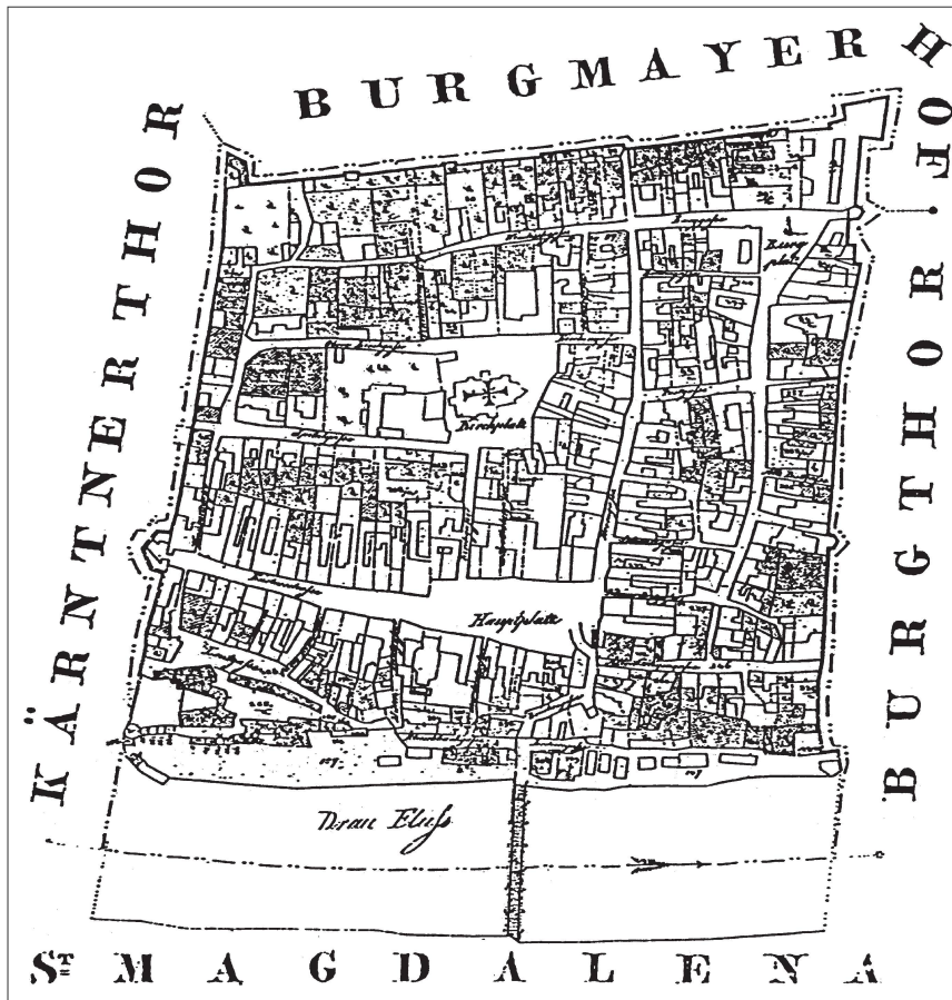
Abb. 4: Maribor/Marburg nach dem Franziszeischen Kataster.

Gestalt einer Raute hatte (Abb. 4), war trapezförmig; hier befand sich die städtische Haupteinfallstrasse aus östlicher Richtung. Die Entwicklung der Verkehrsadern in der Stadt bedingte in neuerer Zeit noch die Gestaltung zweier regelmässig geformter Märkte im Nordosten und im Südwesten. Die aus der alten Marktsiedlung dislozierte Stadt Slovenj Gradec/Windischgraz hatte einen Strassenmarkt, der sich an beiden Seiten verengte, in Richtung Kirche jedoch zu einem querverlaufenden Marktplatz ausbildete. Parallel zum Hauptmarkt verliefen (wie in Kranj/Krainburg) zwei Hauptstrassen. In Škofja Loka/Bischoflack verbreiterte sich die Strasse in einen rechteckig