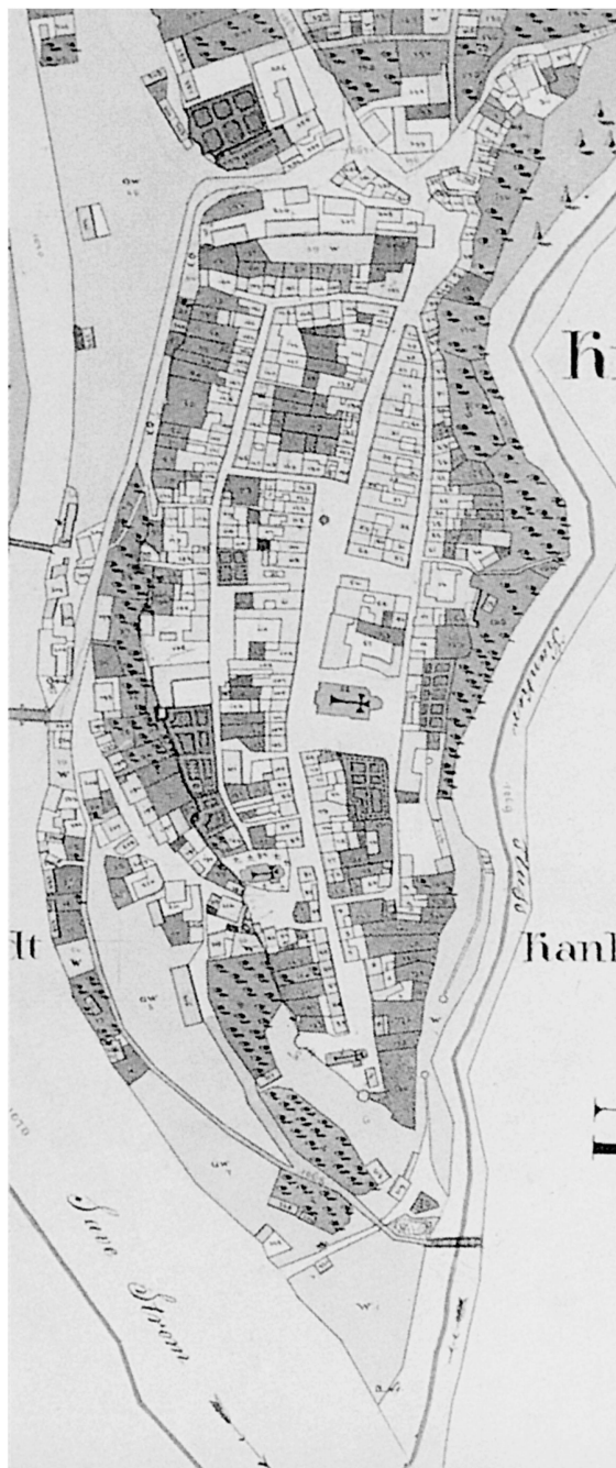
Abb. 1: Kranj/Krainburg nach dem Franziszeischen Kataster.