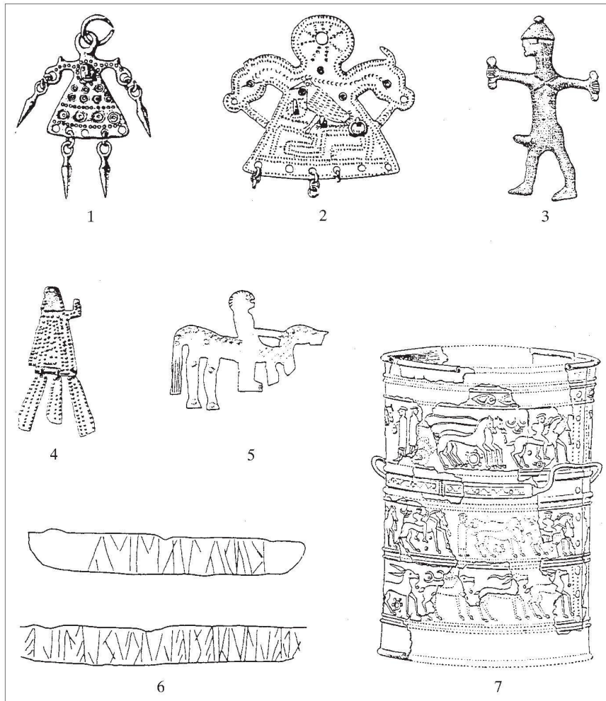
Abb. 3: 1–5 Anthropomorphe Votive. 6 Rätische Inschrift auf einem Pferdevotiv. 7 Eimer (Ziste) mit bildlicher Darstellung. Bronze, verschiedene Massstäbe.