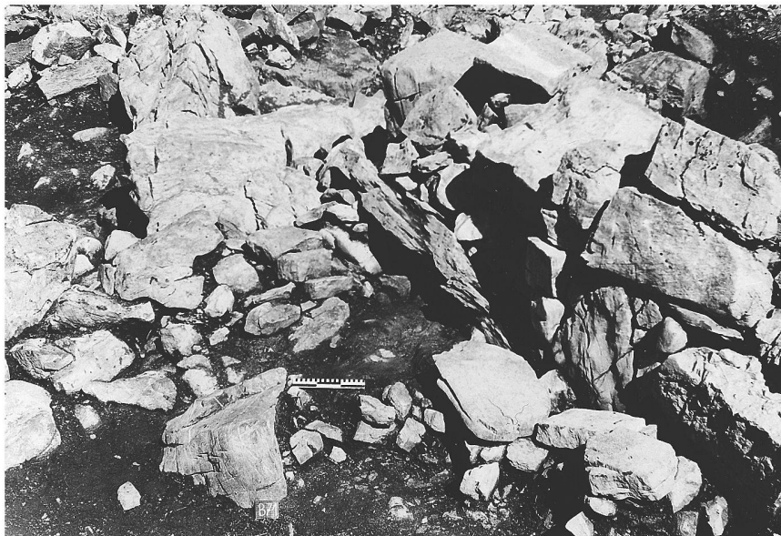
Fig. 3: Site abandonné «Bergeten», Braunwald (Glaris). Foyer à l'intérieur d'une maison d'alpage (XII e -XV e siècles).

de sites. La deuxième vague d'abandons – qui, aux yeux des historiens de la vie quotidienne, va de pair avec la fin du Moyen Âge alpin – intervient vers 1600 avec la détérioration globale du climat que l'on a coutume d'appeler – de façon quelque peu abusive – la «petite période glaciaire». À cette époque, de nombreux sites ont été abandonnés, des habitats jusque-là permanents ont continué d'exister comme stations alpestres temporaires, et de nombreux pâturages situés en haute altitude ont été délaissés en même temps que leurs constructions. Le motif d'une légende largement répandue qui raconte comment un alpage enneigé est enseveli sous les glaces à cause du comportement impie d'un berger constitue peut-être un souvenir de cette détérioration climatique.