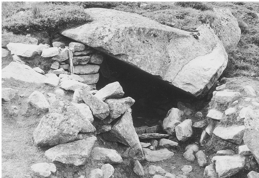
Fig. 2: Site abandonné «Blumenhütte», Hospental (Uri). Petite excavation servant au stockage du lait et des fromages (second Moyen Âge).

Le fait que les recherches archéologiques sur la culture matérielle de l'espace alpin médiéval n'en soient qu'à leurs débuts ne saurait être expliqué par l'absence de vestiges visibles. Comme on le montrera plus loin, l'espace alpin est en effet parsemé, surtout dans les sites au-delà de 1500 mètres environ, de traces d'anciens établissements. En Suisse, un premier effort en vue d'explorer archéologiquement de tels sites a été entrepris très tôt déjà, vers 1850, car on pensait y trouver un pendant aux vestiges lacustres découverts peu auparavant. Mais après que les premiers sites ont été dégagés sans que l'on ait pu enregistrer des trouvailles aussi spectaculaires que celles effectuées par l'archéologie lacustre, le projet fut abandonné à contre cœur. Il fallut attendre 1971 pour qu'une nouvelle tentative soit entreprise, sur le site abandonné de Bergeten au-dessus de Braunwald (Glaris), où un sondage avait permis de mettre à jour, en 1955, des ustensiles en fer datant du Moyen Âge. 9 Depuis lors, diverses fouilles ont été entreprises dans les cantons de Glaris, Schwyz, Uri, Obwald, du Tessin et du Valais, si bien que la recherche sur les sites abandonnés de haute montagne est devenue une