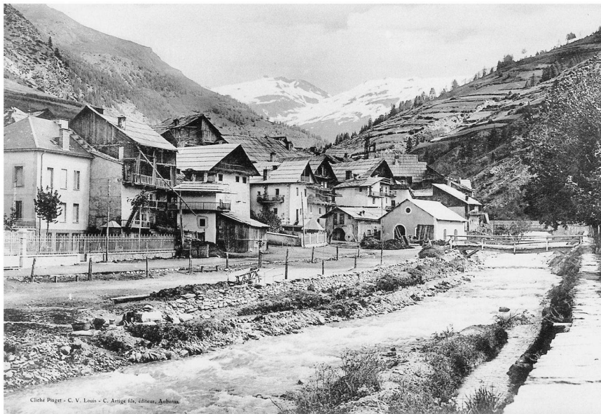
Fig. 5: Une rue à Abriès.

du Dauphiné (SDAP). Tous, en cette période d'essor sans précédent du tourisme, des excursions et de l'alpinisme, viennent découvrir les nouveaux territoires à la mode. Parmi eux, citons à titre exemplaire les clichés des frères Martinotto, ceux d'H. Ferrand ou de R. Blanchard. Ce dernier parcourt, regarde et visualise les Alpes pour des raisons professionnelles, celles de rendre compte d'un phénomène géographique. Il y a là une matière très intéressante, très riche et peu exploitée selon la perspective évoquée.