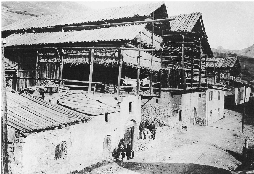
Fig. 4: Une rue à Saint-Véran.

Autre trace irremplaçable, celle que la photo garde des gestes disparus, des activités qui se sont transformées ou qui n'existent plus. On peut penser à certains clichés de la collection Martinotto (Musée dauphinois) qui saisissent par exemple le geste du faucheur, celui du maréchal-ferrand, un artisan essentiel du monde rural et urbain, ou celui du «retoucheur de photo». Avec cet exemple, le photographe se met en scène et témoigne du travail de correction esthétique apporté aux clichés et peut-être de correction tout court. 25 Saisis par le regard et l'appareil des frères Martinotto à des périodes différentes, ces personnages continuent à exister et à informer de pratiques, de savoir-faire d'une société d'un temps autre. Avec la disparition des usages et des compétences qui leur sont associées, ces clichés prennent le statut d'une véritable trace archéologique. Dans ces clichés, les frères Martinotto savent, en professionnels, faire ressortir outre la réalité du geste, (notamment la pesanteur et le rythme du faucheur) l'ambiance générale, que les qualités esthétiques contribuent à créer. Ainsi, la vapeur dégagée par la chaleur du fer travaillé pour être fixé sur le sabot du cheval entoure