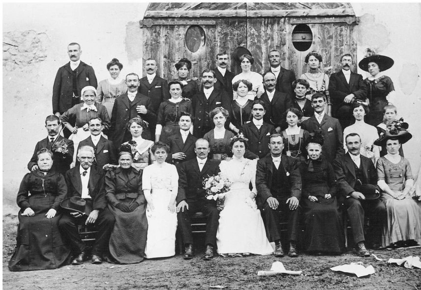
Fig. 2: Un mariage dans le nord Isère. Musée dauphinois.

et sociale et au-delà, la position effective des membres du groupes et l'allure de ceux qui étaient là.