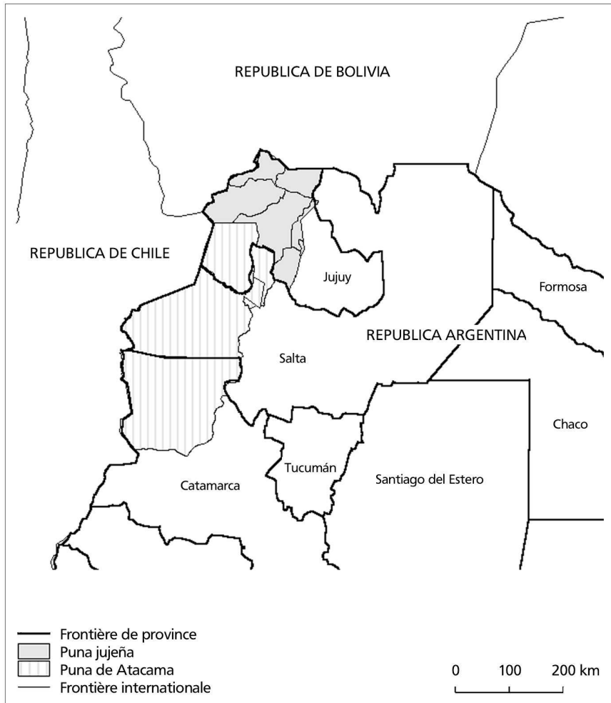
Carte 1: Localisation de la Puna.

la migration dans les terres basses de la province. Depuis lors, les hauts plateaux de Jujuy occupent une position périphérique. Durant les premières décennies du XX e siècle, l'organisation territoriale en vigueur durant la période coloniale fut l'objet d'une profonde modification, suite à l'intégration définitive de la province de Jujuy dans le marché national. Tout au long