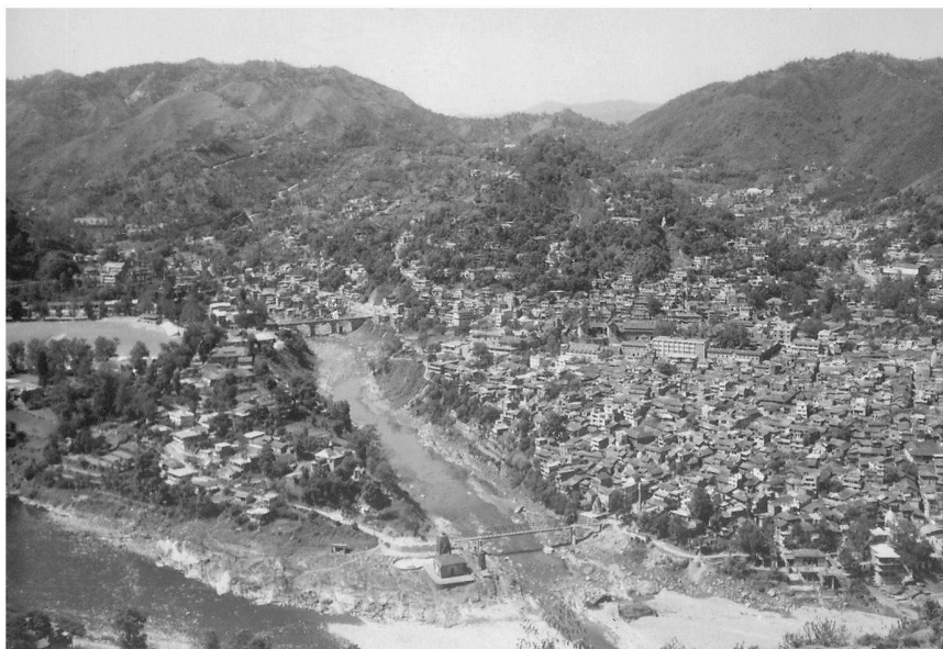
Fig. 2: La ville de Mandi.

la suite, il passa par Sanawar, un «asile pour des garçons et des filles de parents européens ou mixtes», et des «sanatoriums» (Dagshai et Sabathu) qui étaient également des «dépôts militaires» pour les soldats britanniques. 62 À la fin du XIX e siècle, les nombreuses stations de montagne parsemant les sommets étaient devenues une caractéristique dominante dans la région. 63