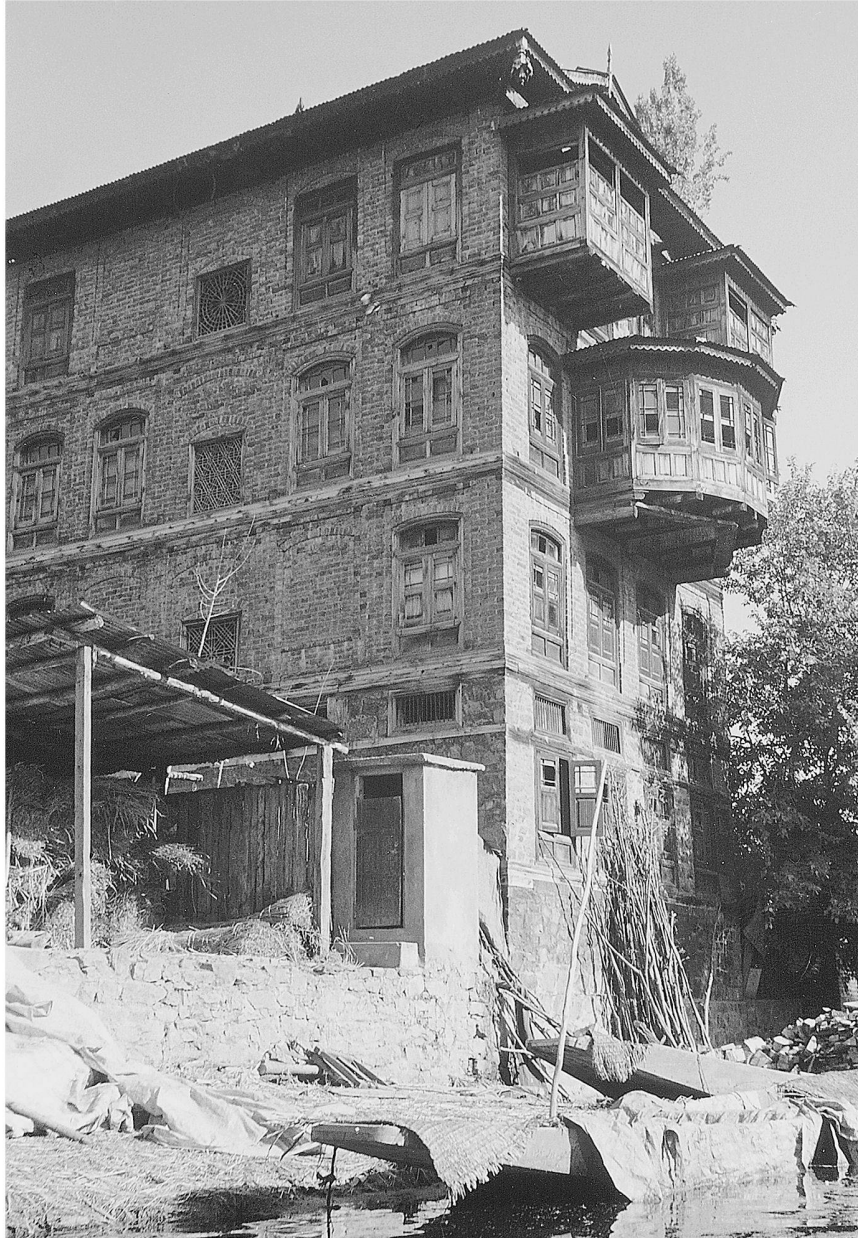
Abb. 1: Srinagar. Wohn- und Gewerbehaus an einem Kanal.