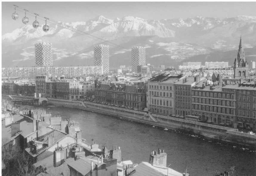
Fig. 4: Vue de Grenoble vers 2000. Carte postale.

transport d'énergie à grande distance, un tel enseignement favoriserait le développement régional. Une école d'électricité industrielle pouvait ainsi devenir l'instrument d'une grande mutation industrielle. «Nous assistons aux débuts d'une évolution qui ne tardera pas à transformer profondément les conditions de la vie industrielle dans notre ville et notre région», affirmait le président de la «Société pour le développement de l'enseignement technique», M. de Renéville qui se disait persuadé d'assister «au commencement d'une évolution qui fera de Grenoble un grand centre industriel analogue à ceux qui se sont formés sur les bassins houillers du Nord et du Pas-de-Calais. Les mines de charbon s'épuiseront; les chutes d'eau resteront et les réserves de nos montagnes en énergie hydraulique sont immenses.»