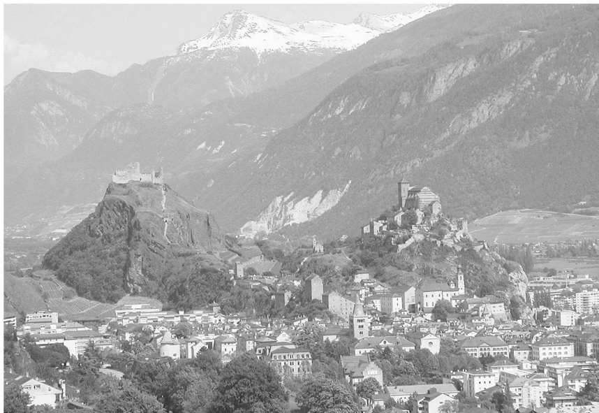
Fig. 3: Vue depuis Mont d'Orge des collines de Valère (à droite) et Tourbillon (à gauche).

notamment à la présence de sauterelles ( Pholidoptera griseoaptera , Oecanthus pellucens ) et de faucons crécerelles. 12