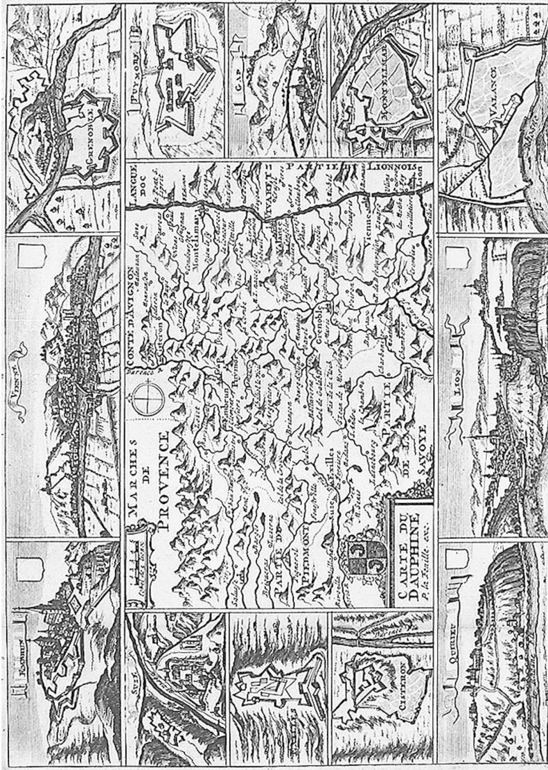
Karte der Dauphiné von La Feuille, Anfang 17. Jahrhundert.