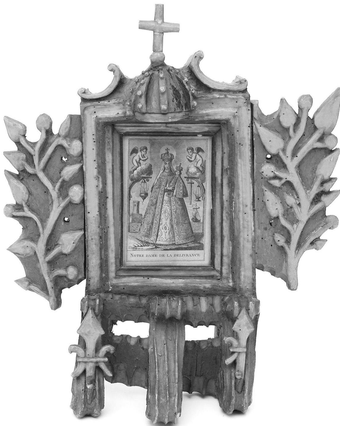
Fig. 1: 17 e siècle. Objet de piété invoqué pour la délivrance des femmes enceintes (Tarentaise, Savoie, France). Acheté par Georges Amoudruz vers 1950 sur place à un fripier-brocantier. Image de la Vierge et montage dans un décor floral, symbole de fertilité, encore sculptée selon la règle du gothique international.