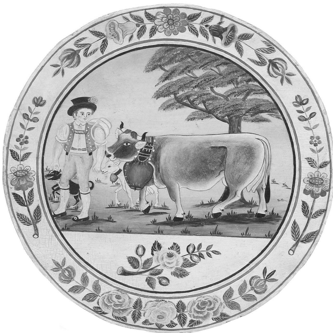
Fig. 3: Fond de seillon en bois peint à l'huile. Appenzell –Toggenbourg, Suisse, 1850. Portrait d'un maître-vacher, le seillon à l'épaule, regardant sa plus belle vache, accompagné de son chien et de sa chèvre, un anneau de roses et campanules en guirlande. Les fonds de seillon (seau à traire) sont utilisés comme panonceaux d'apparat à la façon d'un médaillon, fixé sur le char lors de l'inalpe et de la désalpe.