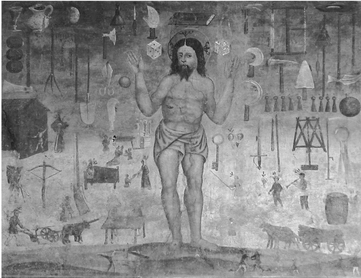
Fig. 4: Christ du dimanche , peinture murale extérieure, 1557. Tesero (Trentin), chapelle Saint-Roch, façade.

de Clamanges, prenant la plume en 1413 pour écrire un traité Contre l'institution de fêtes nouvelles dont il dénonce vigoureusement les effets: «Aussi pour eux, les fêtes ne se célèbrent-elles pas à l'église, non plus qu'à la maison. C'est à la taverne que se déroulent toutes les solennités de leur célébration. C'est là qu'on se rassemble dès le lever du soleil; c'est là qu'on s'attarde souvent jusqu'à la tombée de la nuit; qu'on jure, qu'on parjure, qu'on blasphème, qu'on maudit Dieu et tous les saints; qu'on crie, qu'on se chamaille, qu'on se dispute. Les hommes chantent, hurlent, trépignent, se bousculent, et semblables à des forcenés ont l'air de perdre la tête. Ils trafiquent en outre, passent des marchés, louent leur travail, se disputent, font la paix, entament des procès, se tendent des pièges à tour de rôle, à coup de mensonges et de fraudes. Celui qui a roulé l'autre par les ruses les plus grandes ou les marchés les plus trompeurs, est, par toute la bande, proclamé le plus sage. Chaque