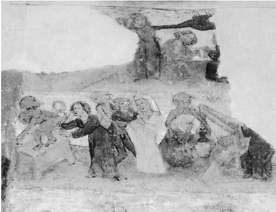
Fig. 3: Christ du dimanche, détail. Peinture murale extérieure, atelier de Jean de Ljubljana, entre 1455 et 1460. Crngrob (Slovénie), sanctuaire Sainte-Marie, façade.

luxure dans le Christ du dimanche de Crngrob qui associe les motifs hautement signifiants – véritables codes symboliques – du miroir, de la robe rouge, des cheveux dénoués, atteste que ces sujets étaient largement connus et faisaient partie du langage des artistes d'une extrémité à l'autre de la chaîne alpine. S'il restait le moindre doute sur la circulation intra-alpine de ce vocabulaire, la présence du motif de la gueule de l'Enfer – un unicum dans l'iconographie du Christ du dimanche – qui conclut la composition de Crngrob, le dissiperait. Un demi-siècle plus tard, le Christ du dimanche peint sur le mur méridional de l'église Sainte-Elisabeth de Pristava (près de Polhov Gradec) développe avec les mêmes termes la dénonciation de la luxure. 17