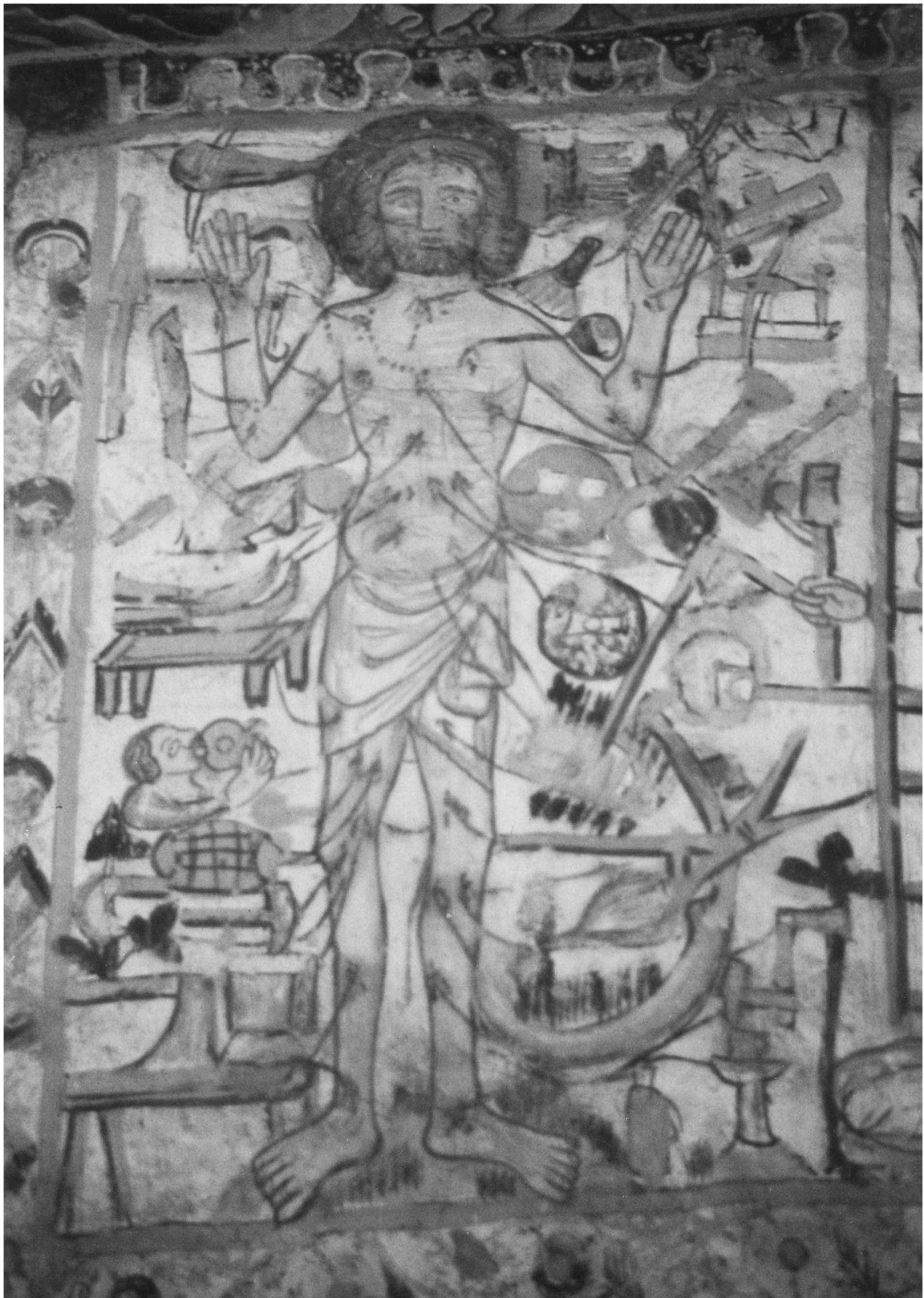
Fig. 1: Christ du dimanche , peinture murale vers 1350. Rhäzüns (Grisons) église Saint-Georges, nef, mur nord.