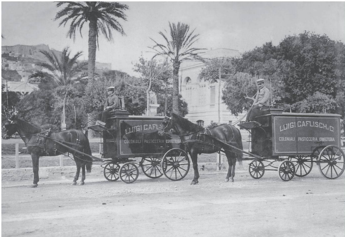
Abb. 3: Lieferwagen der Firma «Luigi Caflisch e Compagni» mit der Aufschrift «Coloniali Pasticceria Confetteria» unterwegs in den Strassen von Neapel – im Hintergrund links der Vomero, der Hausberg Neapels.

bäcker in die weite Welt zu schicken, wo sie allerdings, wenn ihnen das Glück lächelt, glänzendere Geschäfte machen können, als ein Handwerker in seiner Heimat. Aber wie vielen ist das Glück günstig? Kann man sagen, dass von zehn Zuckerbäckerjungen einer reich wird? Geht nicht vielmehr weit der grössere Teil dieser Auswanderer einer traurigen Sklaverei und einem frühen Tod entgegen?» 24 Die Totenmatrikeln unserer Kirchenbücher sprechen eine deutliche Sprache. Die Arbeit in feuchten und heissen Backstuben und eiskalten Kellern war ungesund, lange Arbeitszeiten waren die Regel. Viele Lehrbuben wurden von ihren Landsleuten regelrecht ausgebeutet und sogar misshandelt. Mancher Jugendliche ist an den Anforderungen, an der Übermüdung und am Heimweh zerbrochen.