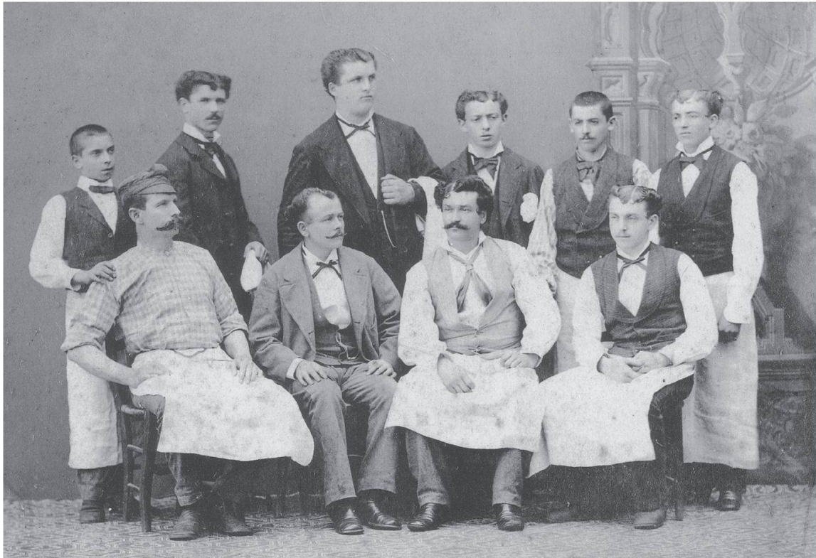
Abb. 4: Belegschaft einer Bündner Zuckerbäckerei in San Pier d' Arena (Italien).