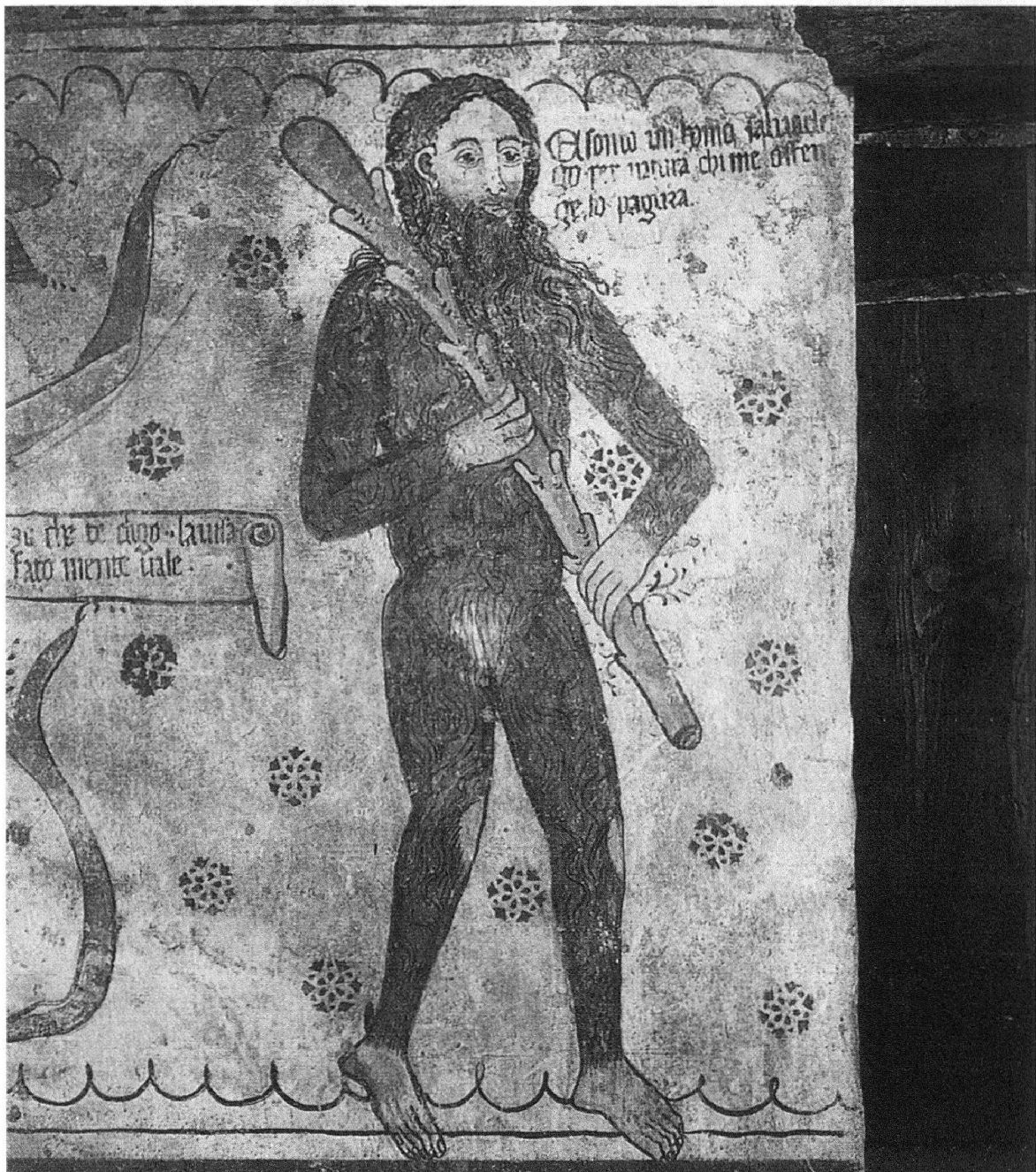
Fig. 3: Homme sauvage . Source: Fresque de Simon et Battatestinus (famille Baschenis), mur Est de la Camera Picta Zugnoni Vaninetti, Sacco in Val Gerola, 1464.

au monde sauvage ne se joue pas sur le mode de l'opposition nature/culture, mais sur celui de l'association: postés de part et d'autre de la porte l'archer et l'homme sauvage coopèrent pour protéger la demeure.