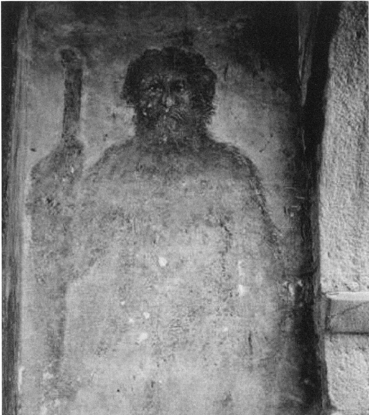
Fig. 4: Homme sauvage . Source: Fresque anonyme, intérieur de la porta poschiavina, Tirano, vers 1551 .

Alpes germanophones. Dans le Trentin, le personnage apparaît à Cavalese dans le Val di Fiemme dès la fin du XV e siècle. Sur la paroi occidentale du palais Riccabona, édifié par la famille autrichienne des Firmian, une famille sauvage a été peinte à fresque à l'extérieur de l'édifice et semble, comme pour les images lombardes, garder les lieux. 32 L'homme sauvage se retrouve également