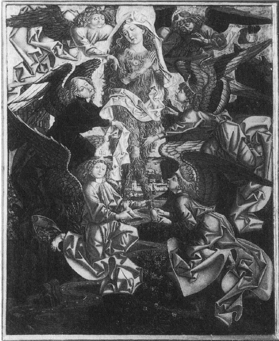
Fig. 5: Élévation de sainte Marie-Madeleine . Source: Panneau central du retable de Friedrich Pacher, église saint Korbinian de Thal, 1498 .

l'espace germanique dès le XIV e siècle, apportée en particulier par les ordres mendiants. 40 Ainsi, à Bergame, saint Onuphre apparaît sur une fresque réalisée dans la basilique Santa Maria Maggiore dans la seconde moitié du XIV e siècle. Elle représente le saint de plein pied, entièrement couvert de poils et muni d'un bâton de pèlerin. 41 L'image se diffuse au pied des montagnes piémontaises