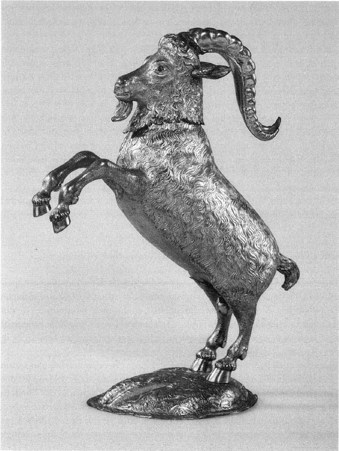
Abb. 3: Burgerbecher aus dem Churer Rathaus; Silber, gegossen, graviert und vergoldet, zweite Hälfte des 17. Jahrhunderts. Der abnehmbare Kopf bildet den Deckel des 23,3 Zentimeter hohen Trinkgefäßes, das auch als Tafelschmuck diente.