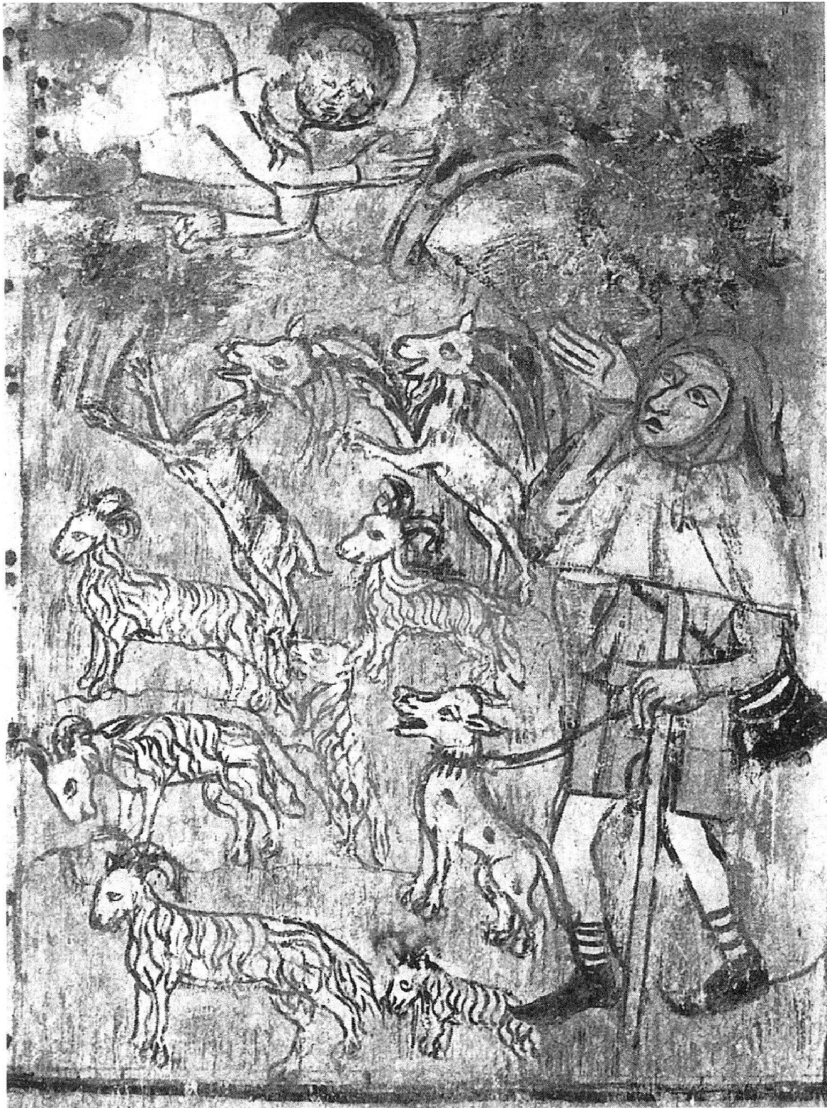
Abb. 2: Verkündigung an die Hirten. Fresko des Rhäzünser Meisters an der Westwand der Kirche St. Georg, Rhäzüns, zweite Hälfte des 14. Jahrhunderts. Steinböcke am Rande einer Ziegenherde.