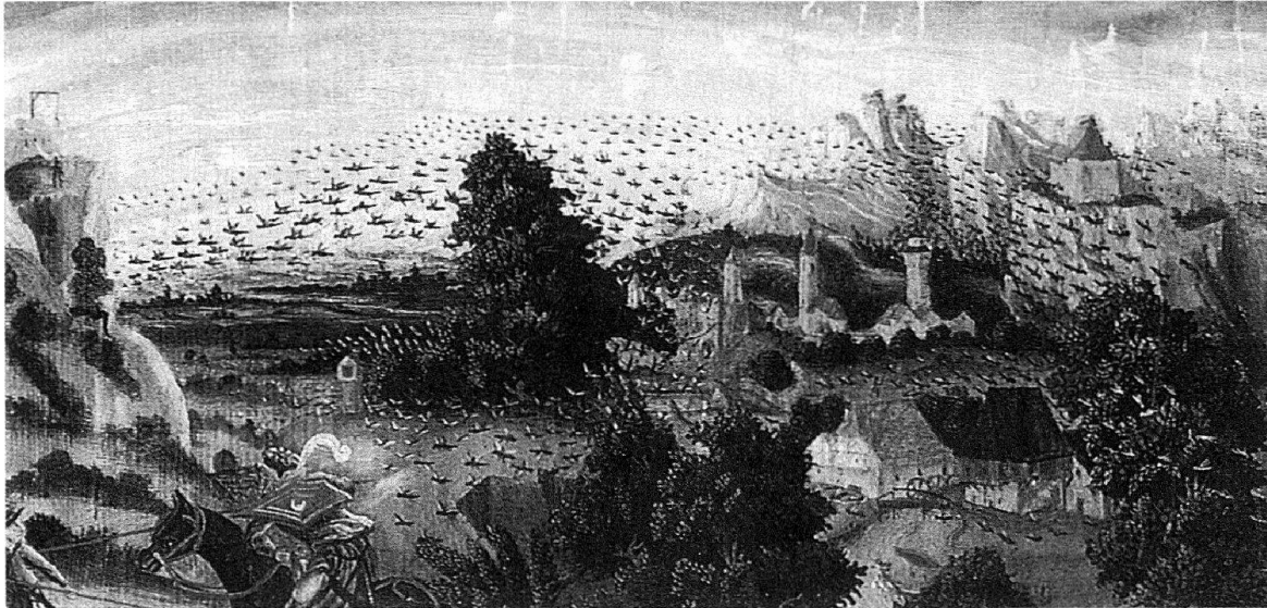
Fig. 1: Le piaghe divine , quadro di legno a olio (1550 circa): dettaglio con l'invasione di cavallette verso il 1540 in Austria Inferiore.

giorni gli uomini cercheranno la morte, ma non la troveranno; desidereranno di morire, ma la morte fuggirà da loro. Or l'aspetto delle locuste era simile a cavalli pronti alla battaglia; e sulle loro teste avevano come delle corone d'oro, e le loro facce erano come facce d'uomini. E avevano capelli come capelli di donna e i loro denti erano come denti di leone. Avevano delle corazze come corazze di ferro, e lo strepito delle loro ali era come lo strepito di molti carri e cavalli lanciati all'assalto. Avevano delle code simili a quelle degli scorpioni, e nelle loro code avevano dei pungiglioni nei quali risiedeva il potere di danneggiare gli uomini per cinque mesi. E avevano per re sopra di loro l'angelo dell'abisso, il cui nome in ebraico è Abaddon e in greco Apollion.» I numerosi accenni biblici alle invasioni di cavallette influenzano considerevolmente i modelli di percezione e d'interpretazione del fenomeno presso le popolazioni nel medioevo e nell'età moderna. Tutte le invasioni di locuste erano infatti interpretate come catastrofi e punizioni divine indipendentemente dall'entità dei danni.