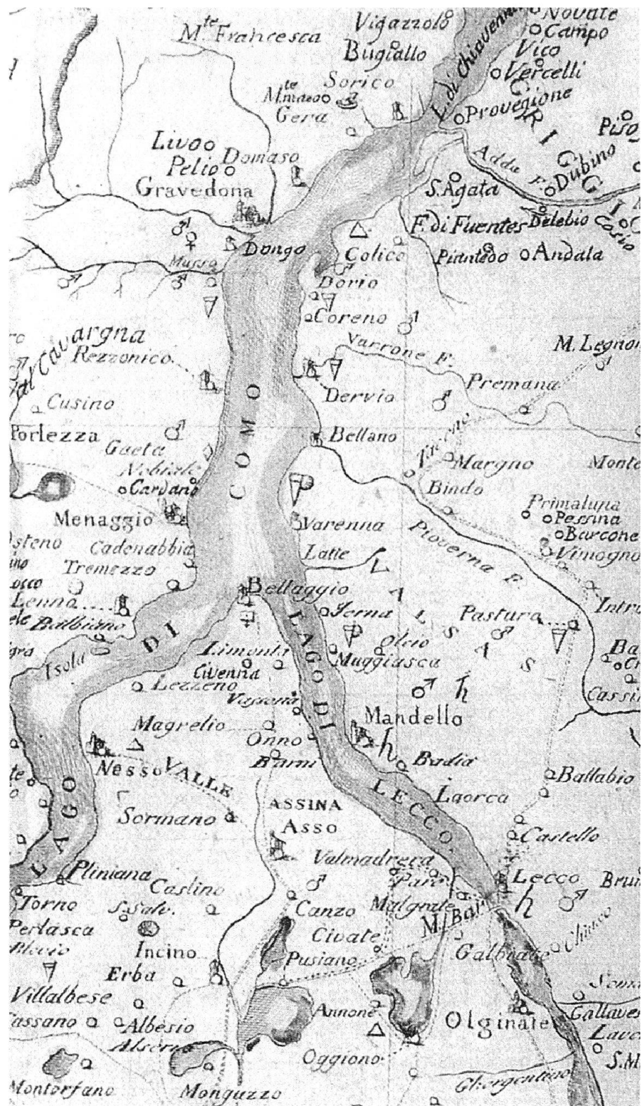
Fig. 1: Il lago di Como. Particolare di una mappa pubblicata in C. Amoretti, Viaggio da Milano ai tre laghi maggiore, di Lugano e di Como e ne' monti che li circondano , Milano 1806. Ristampa anastatica a cura di Raffaello Ceschi.