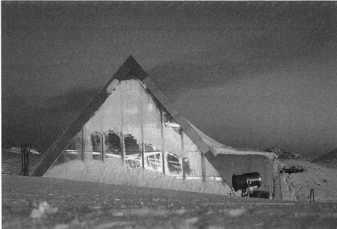
Fig. 4: Seggiovia Carmenna, Arosa, Arch. Bearth & Deplazes.

transito nord-sud, ma anche est-ovest. Un Cantone dove tanta gente ha lasciato le proprie tracce.