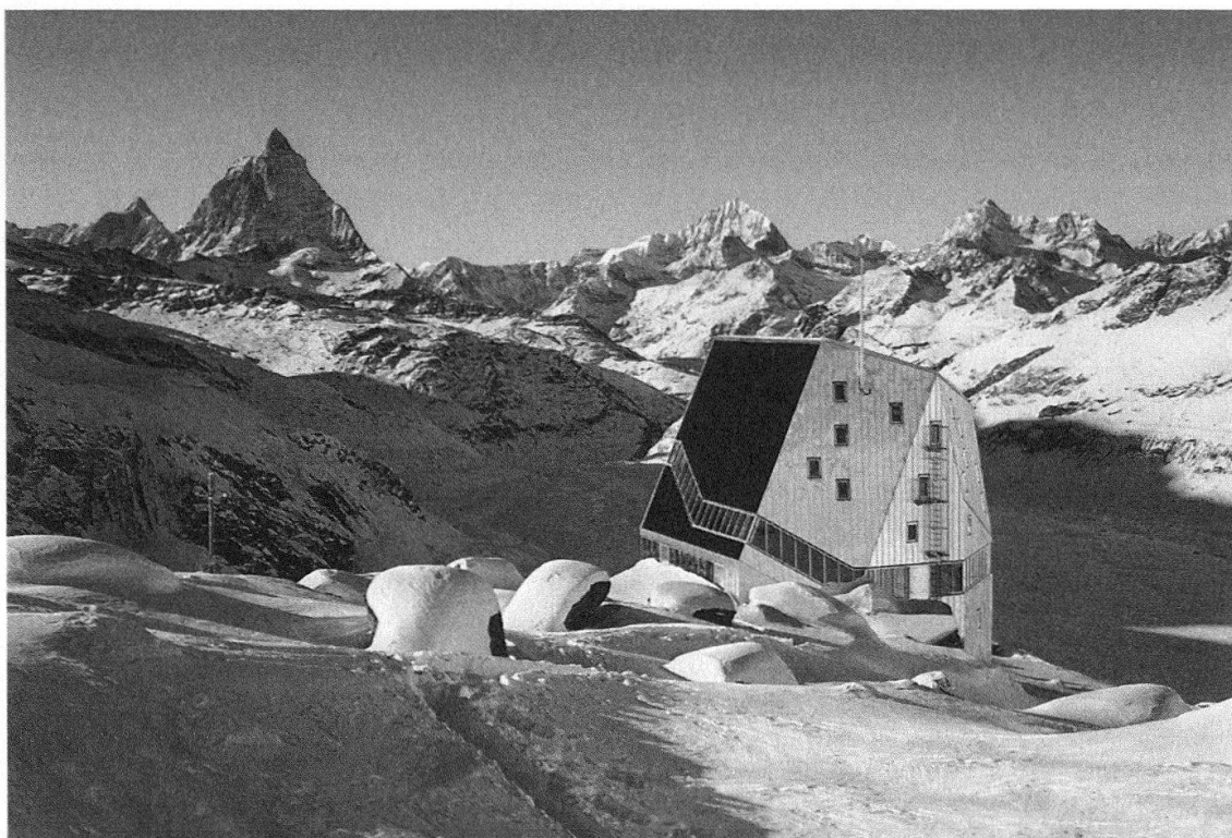
Fig. 3: La Capanna Monte Rosa.

tornare a Berlino; l'architetto Henry van de Velde gli chiedeva come potesse sopravvivere a Davos, un luogo tanto discosto. Anche il giovane Castrop, protagonista del romanzo Der Zauberberg , pubblicato da Thomas Mann nel 1924, lascia la pianura per trasferirsi in questo luogo dimenticato. L'altra figura è quella di Alberto Giacometti, che partendo da Stampa, in Bregaglia, una valle estremamente stretta, con montagne forti e presenti, con una spazialità in cui vi è solo l'alto e il basso, si trasferisce a Parigi, la metropoli che all'epoca era il centro internazionale dell'arte. Nello studio di 16 metri quadrati in rue Hippolyte dove lavorava, si trovava circondato dalla grande città, ma lui era nel suo atelier , nella sua intimità. Lo scultore viveva a Parigi e una volta all'anno visitava la Bregaglia e condivideva questi due luoghi; è come se in lui fosse avvenuta la fusione dei due mondi.