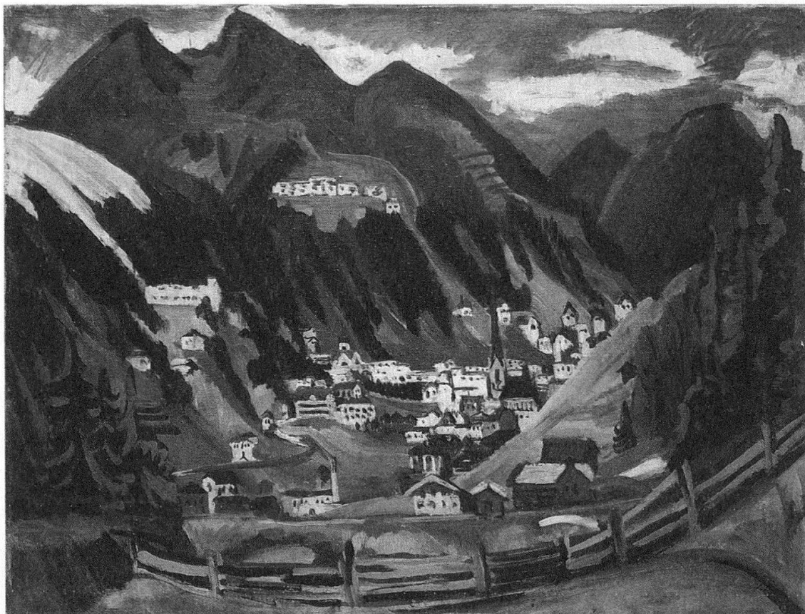
Fig. 1: Ernst Ludwig Kirchner, Blick auf Davos (1924) . Fonte: Per gentile concessione del Museo d'arte dei Grigioni, Coira.

VB: Da poco, forse, vi è la ripresa di una nuova sensibilità. Penso all'inizio del XX secolo, precisamente al 1905, quando nei Grigioni è stato fondato il Bündler Heimatchschutz come reazione all'inizio dell'industrializzazione e all'urbanizzazione turistica del Cantone con gli alberghi, le dighe, gli impianti elettrici e la ferrovia. In quel momento è nato anche il dibattito che attirava l'attenzione sul rapporto con il paesaggio, le nuove attività e le nuove esigenze introdotte dal turismo. Durante gli ultimi secoli è cambiato anche il modo di vedere le montagne. Nell'Ottocento i cittadini hanno scoperto le Alpi, probabilmente per la prima volta, quale luogo di ricreazione; un territorio alternativo dove poter godere di un'esperienza molto diversa da quelle possibili in città. Il pittore Ernst Ludwig Kirchner, che è arrivato da Berlino a Davos negli anni 1920, ha espresso questa nuova sensibilità nei suoi quadri, che rappresentano in maniera esemplare il mondo alpino e lo spirito del tempo.