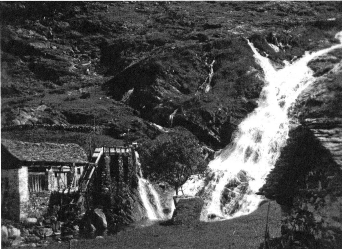
Fig. 2: Segheria presso la cascata del Cioss a Fusio in Valmaggia, attorno al 1920.

tutti prestano nobiltà a questo Lago, oltre al grandissimo utile. Il che non si trova in niuno Lago d'Italia». 37