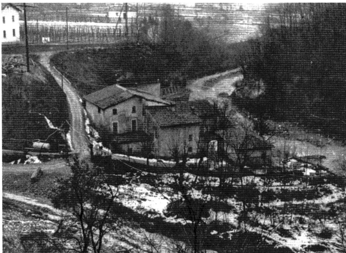
Fig. 3: Il Mulino del Ghitello tra Morbio Inferiore e Balerna, durante i lavori di incanalamento della Breggia all'inizio degli anni 1960.