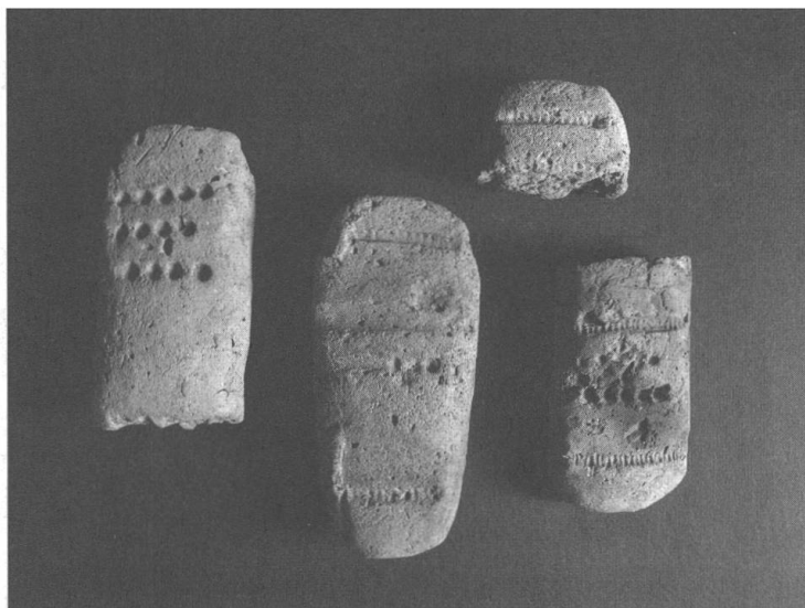
Fig. 3: Gli oggetti enigmatici di Sotciastel (Val Badia). Bronzo medio.

Significativi influssi da oriente si registrano anche con riferimento al fenomeno dei cosiddetti oggetti enigmatici dell'antica e media età del Bronzo. Queste tavolette di terracotta, recanti segni impressi o incisi, di incerta interpretazione funzionale (un loro significato «culturale» non può essere a priori negato) mostrano una vastissima diffusione geografica tra i Balcani, l'area danubiana e alpina e l'Italia settentrionale. Se gli esemplari del Trentino 38 e dell'Alto Adige 39 sembrano dipendere dal forte nucleo di concentrazione di questi reperti in area gardesana, e in generale dai contatti esistenti tra le comunità facenti capo alla cultura di Polada, il fenomeno italiano è legato a forme di irradiazione da e verso oriente che danno luogo a una complessa trama culturale di scambi e relazioni, che non esclude nemmeno la migrazione, ma che come minimo presuppone vie consolidate di percorrenza e probabilmente relazioni intense e continue. Come annota de Marinis: «L'area padana della cultura di Polada denota, quindi, maggiori legami di quanto non si sospettasse con i gruppi nordalpini a sud del Danubio, legami che non si limitano ad aspetti della cultura materiale come l'identica evoluzione nella tecnologia del rame e del bronzo, reciproche influenze nella tipologia dei manufatti in metallo e scambi di prodotti finiti, i rapporti con Wieselburg-Gata per alcune forme ceramiche, la presenza delle cd. tavolette enigmatiche (Brotlaibidole). I legami tra area nordalpina e