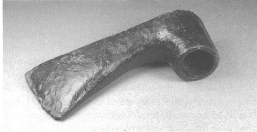
Fig. 2: Ascia ad occhio in rame rinvenuta a Elvas presso Bressanone. Tarda età del Rame.

utilizzabili, e certamente utilizzate specialmente nella preistoria recente e nella protostoria, si potevano trovare localmente anche nell'arco alpino orientale. La selce è una roccia sedimentaria comune nelle aree caratterizzate appunto da rocce di questo tipo (il calcare). Ciò significa che in territori prevalentemente metamorfici o cristallini, come è per esempio l'Alto Adige, la selce doveva, salvo rare eccezioni (cf. le formazioni del Livinallongo) essere importata da Sud (Val di Non, Lessini-Monte Baldo, v. infra). Specialmente nel Mesolitico il cristallo di rocca, reperibile in Valle Aurina, rappresentava un valido sostituto, o almeno una integrazione alla scarsità di selce.