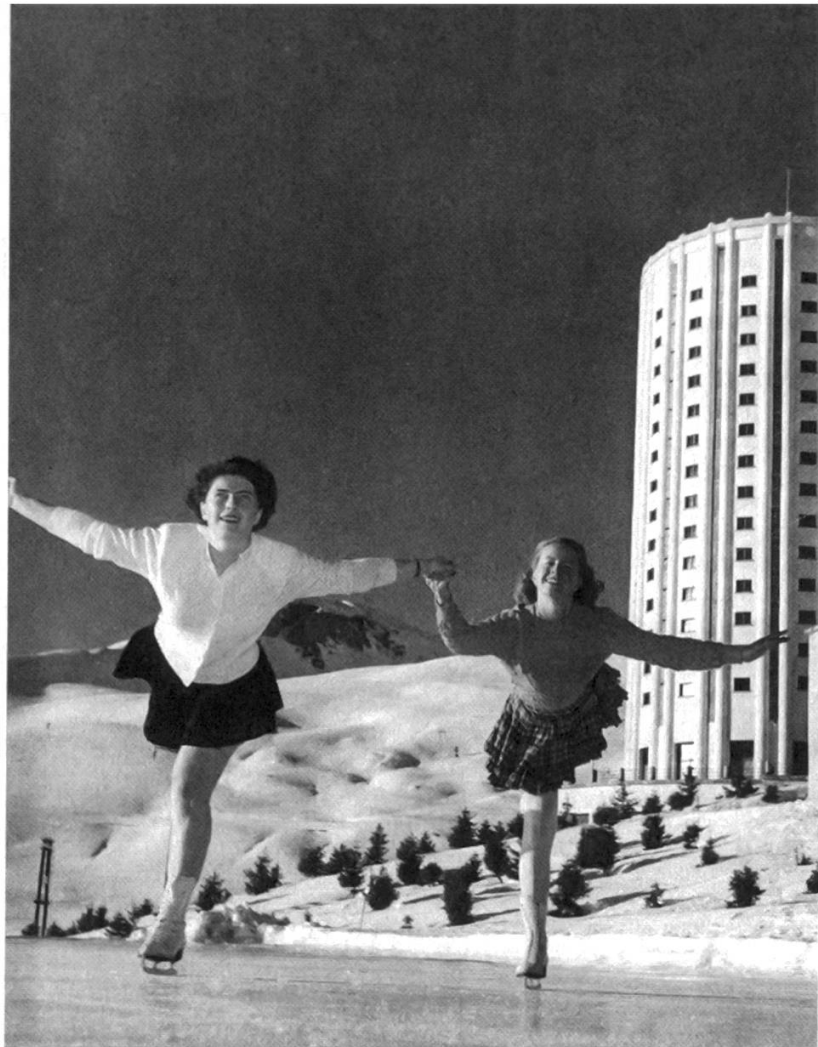
Fig. 3: Pattinaggio al Sestriere (1950 ca).