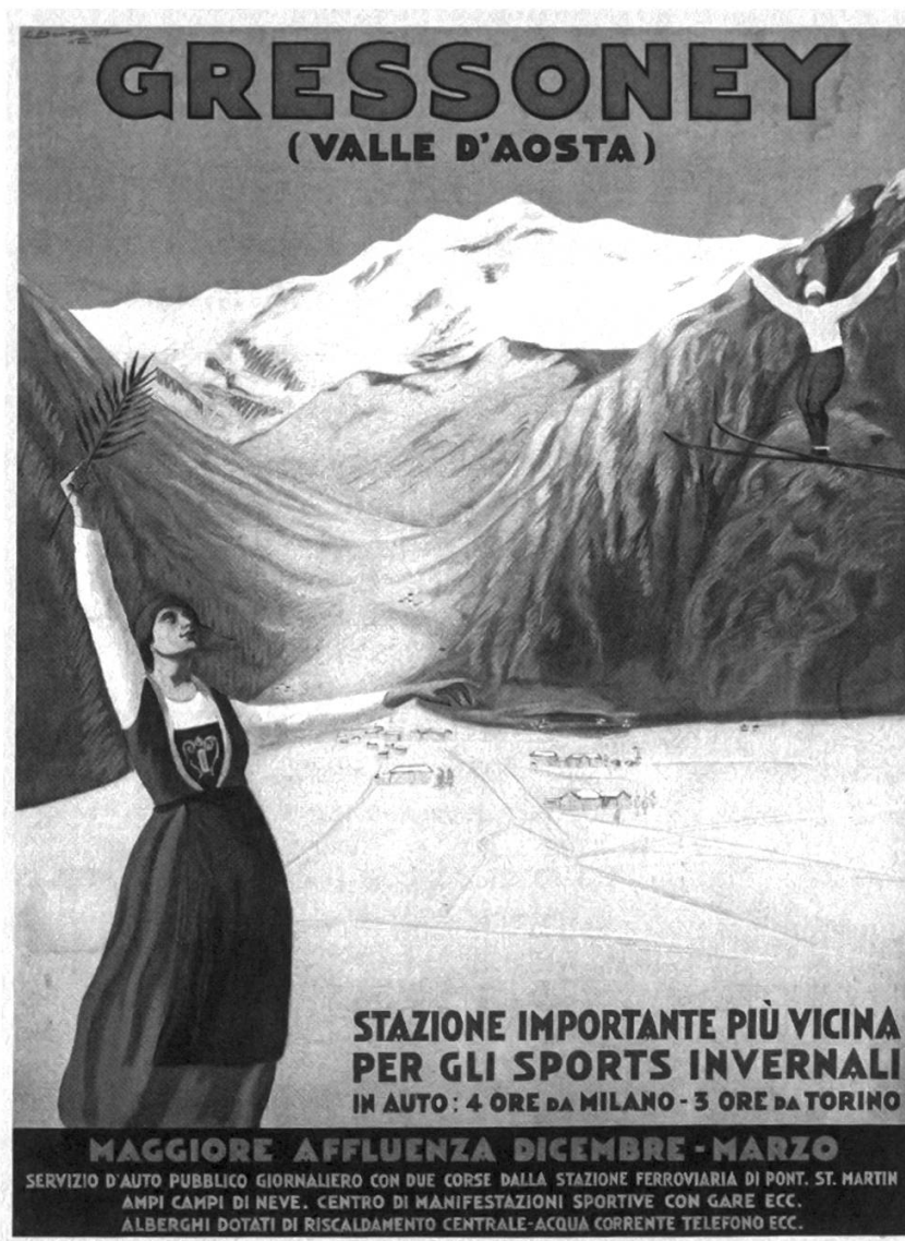
Fig. 2: Manifesto di C. Bonfatti (1929).

una cultura automobilistica e perciò funzionale ad un accesso esclusivamente in auto. Auto e sci nascono praticamente insieme: quando nel 1904 l'ingegner Kind cominciava ad aggregare i primi sciatori, a Torino circolavano 145 vetture e la Fiat, nata nel 1899, cominciava a dare segni di buon sviluppo; hanno quindi in comune «una visione diffusa squisitamente modernista, basata su un certo modo di vivere e consumare il territorio alpino». 23 E Sestriere ne è l'esempio più evidente: la conformazione del terreno, favorevole allo sci, ha indotto negli anni Trenta il Senatore Agnelli, presidente della Fiat, a far progettare una località sciistica di alto livello qualitativo con lo specifico scopo di far raggiungere rapidamente i campi di sci all'alta borghesia torinese con quei mezzi che negli anni Trenta cominciavano a diffondersi nelle classi più agiate. Nella stessa logica di Sestriere in tempi successivi si sono sviluppate molte località