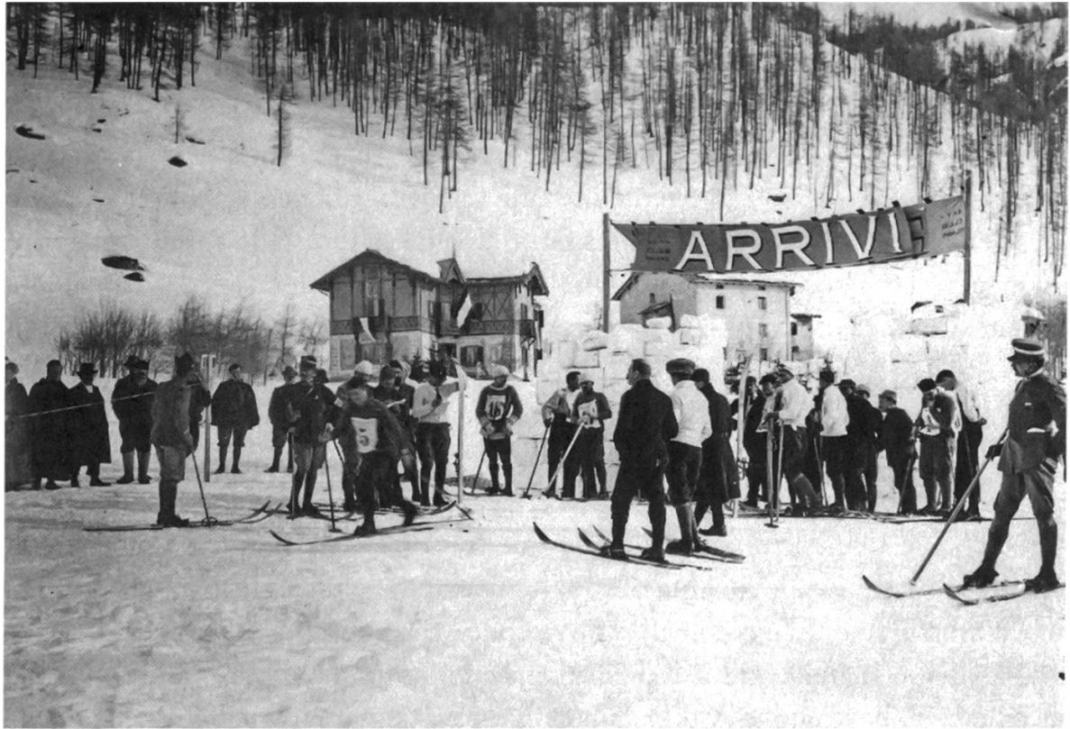
Fig. 1: Gara di sci a Madesimo (1911).

pregiata località termale, ma fu attorno al 1830 che venne avviata la costruzione di Bagni Nuovi perché «quelli <vecchi> erano ormai insufficienti per accogliere la clientela che giungeva sempre più numerosa grazie al nuovo collegamento stradale (strada dello Stelvio, n. d. a.)». 4 Cortina d'Ampezzo fu scoperta verso la fine dell'Ottocento dall'aristocrazia austro-ungarica e dall'alta borghesia inglese, così come S. Martino di Castrozza in Trentino diventò una delle località di villeggiatura preferita dall'alta società viennese. 5 Più in ombra, tra i luoghi di cura e soggiorno estivo della seconda metà dell'Ottocento, le località delle Alpi occidentali, considerato che a Bardonecchia, località di punta della Val di Susa, nel 1884 si contavano «100 soggiornanti ospitati in ville e case d'affitto». 6 La conseguenza di questo primo periodo di fulgore fu la costruzione di grandi e lussuosi hotel, le cui caratteristiche saranno sempre più in sintonia con lo stile di vita e con l'atmosfera gaudente della belle époque , che caratterizzava quel periodo. A Madonna di Campiglio la coppia imperiale veniva accolta nel 1885 al Grand Hôtel des Alpes che garantiva da solo 200 posti 7 , nel 1877 a Dobbiaco veniva inaugurato il Südbahnhotel dalla società ferroviaria della Val Pusteria, nel 1896 il Karerseehôtel, a 1650 metri di altezza nei pressi dell'omonimo lago, con